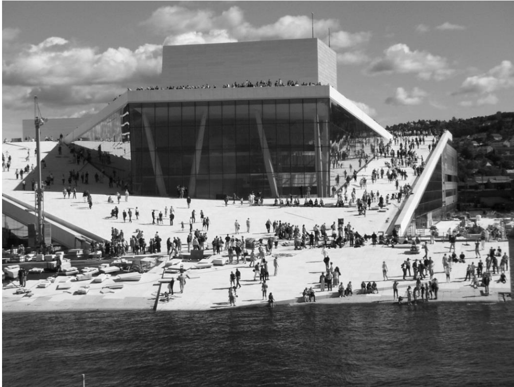
Рис.1. Норвезька національна опера Norwegian National Opera and Ballet

від інноваційної ідеї, яка вирішена всупереч встановленим поєднанням звичайних програм, сенс її існування базується на новизні підходу і несподіваному змішуванню функцій.