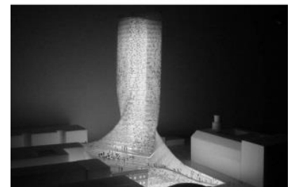
Рис. 4. Scala

З іншого боку, вежа Scala бюро BIG в Копенгагені, критикує німі екстер'єри монолітних веж і «розчиняє» її фасад з оточуючими вулицею і площею за допомогою ряду терас, що перетворюють громадський ландшафт в частину фасаду.