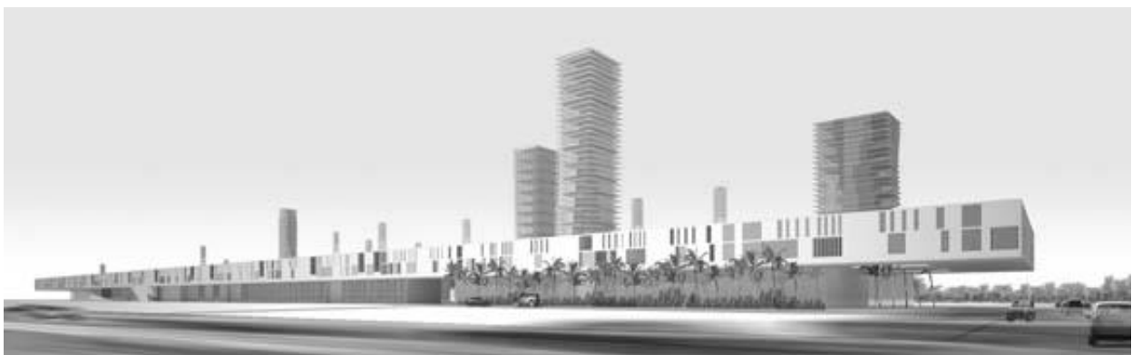
Рис. 2. Kuwait Sports Shooting Club

Інтегровані ландшафти. Частково стимульовані державними ініціативами, частково за рахунок зацікавленості в публічному просторі, багато гібридів інтегрують громадську функцію, розміщуючи поверхню міста над спорудою, або шляхом влаштування його вертикально в структурі споруди у вигляді комплексу піднятих площ, садів і галерей. Громадський простір та ландшафт гібридизуються із іншими програмними елементами будинку.