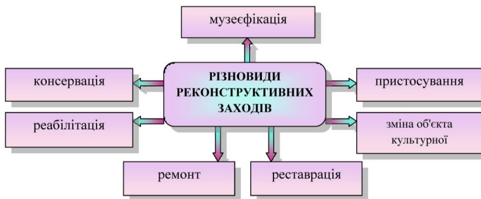
Схема 1. Різновиди реконструктивних заходів

Внаслідок цього повинні бути чітко визначені цілі та засоби реконструктивних заходів, співвідношення в середині них збережених і відновлених елементів з оптимальним ступенем реконструкції. Згідно закону України «Про охорону культурної спадщини» розрізняють наступні поняття (див. схему 1):