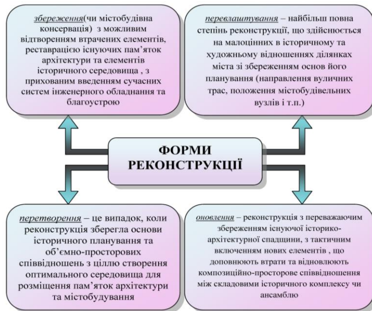
Схема 2. Форми реконструкції

Провівши дослідження вітчизняних та зарубіжних діячів науки, можна виділити наступні форми реконструкції, що будуть стосуватися сформованого міста в цілому (див. схему 2):