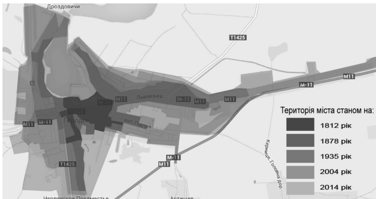
Рис. 3. Схема автора. Планувальний розвиток міста Городка

Проаналізувавши архітектурно-просторовий розвиток міста від початку створення першої його карти і до сьогодні (див. рис. 3), виокремлюємо той факт, що із збільшенням населення міста і зростанням його територій переваги центричної планувальної структури поступово втрачаються.