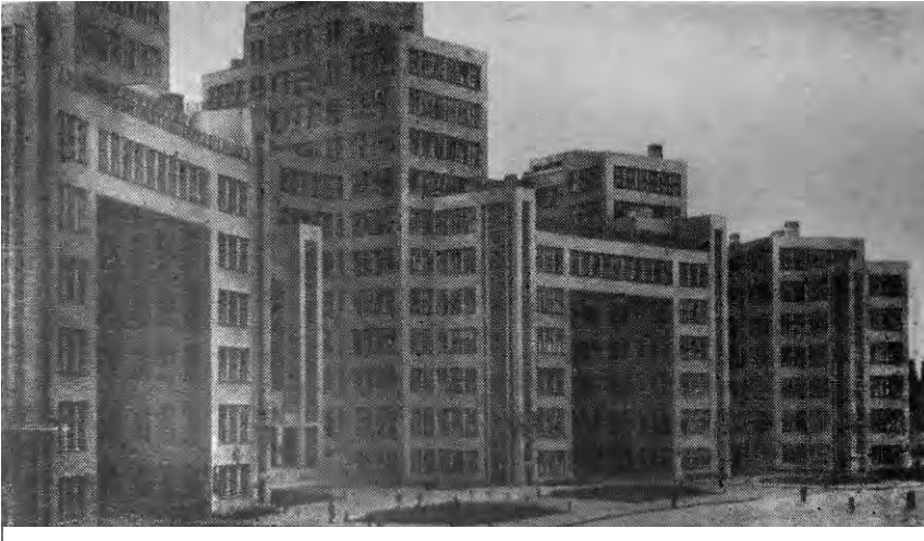
Іл. 1. Харків. Держпром. 1925–1928 рр. Советская архитектура. — М.: Стройиздат. 1984.

Кожного, хто заходить між корпусами, вражає незвичайність просторового самопочуття, яке складається в різноманітності ракурсів, стрімкості пропорцій величезного інтер'єру на відкритому повітрі, в лаконізмі і суворості деталей. В рамі корпусів і переходів звідси відкривається широка картина майдану»[3].