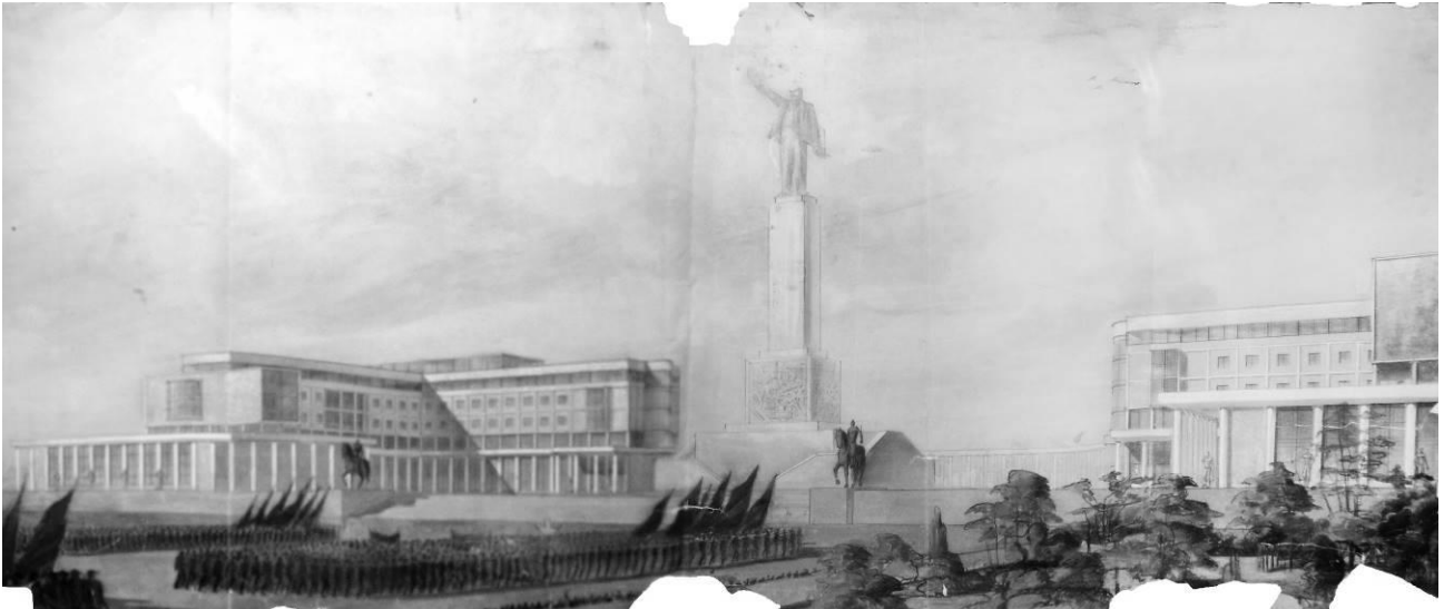
Іл. 6. РНК і ЦК КП(б)У, перспектива з боку площі. Другий конкурс. 1935 р. Друкується вперше.

Монумент Леніну піднімається на високий прямокутний постамент на кубічному цоколі з барельєфом. Композиція розміщується на стилобантій частині з симетричними сходами.