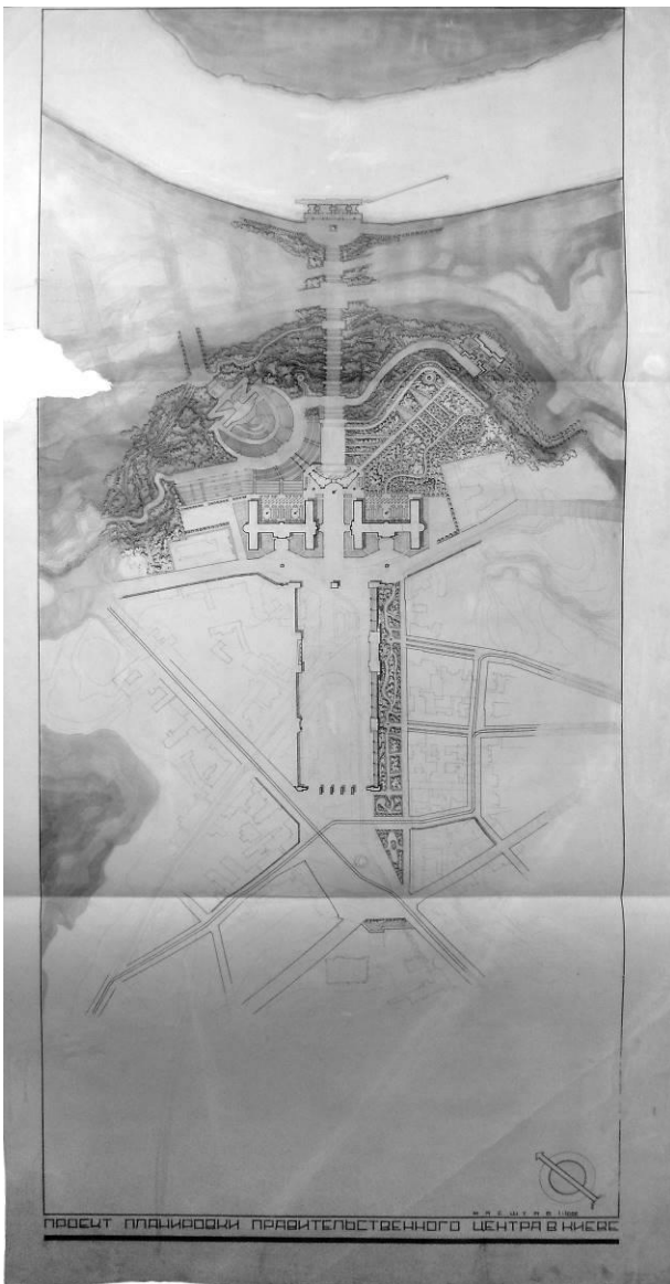
Іл. 4. Генплан. Перший конкурс. 1935 р. Друкується вперше.

Споруда складається з двох прямокутних 7 - поверхових симетричних корпусів РНК і ЦК КП(б)У, що фланкуються двома заокругленими з обох сторін 12 - рівневими баштами. Між собою корпуси об'єднані аркою, над якою перекинутий трирівневий перехід. Споруда стоїть на стилобаті. Перші два поверхи мають виноси з колонадами, що намічають головні входи у будівлі. Нижні частини двох башт мають розвинені прямокутні основи висотою в два поверхи, видовжені перпендикулярно спорудам вздовж основної осі композиції площі. Цим виносам відповідають ідентичні за габаритами виступи на протилежних кінцях РНК і ЦК КП(б)У. Таким чином, перші два рівні споруд