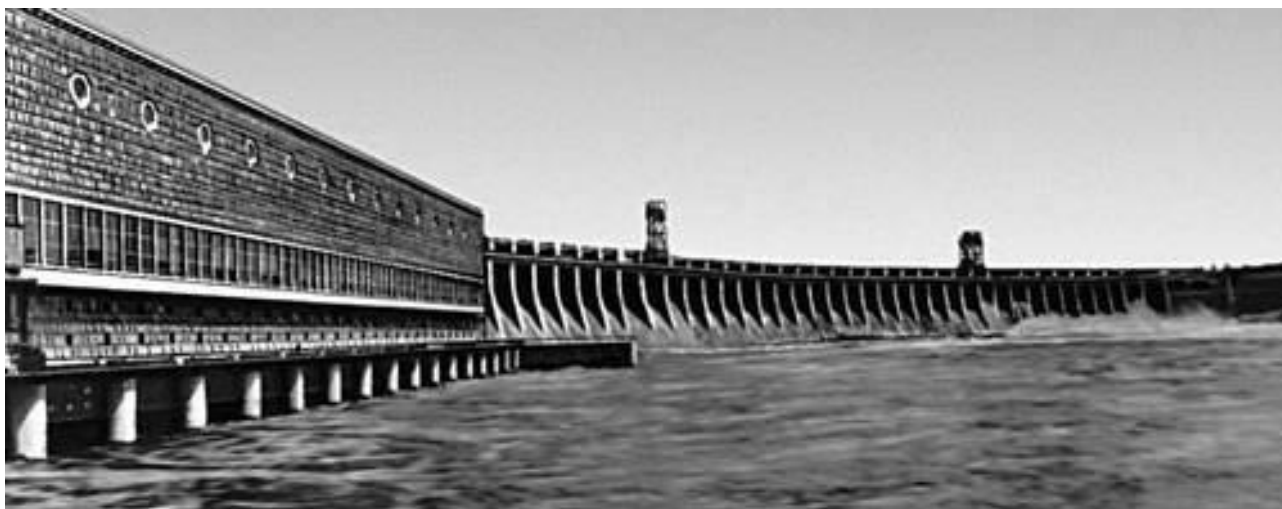
Іл. 2. Дніпрогес. 1927–1932 рр. Велика радянська енциклопедія.