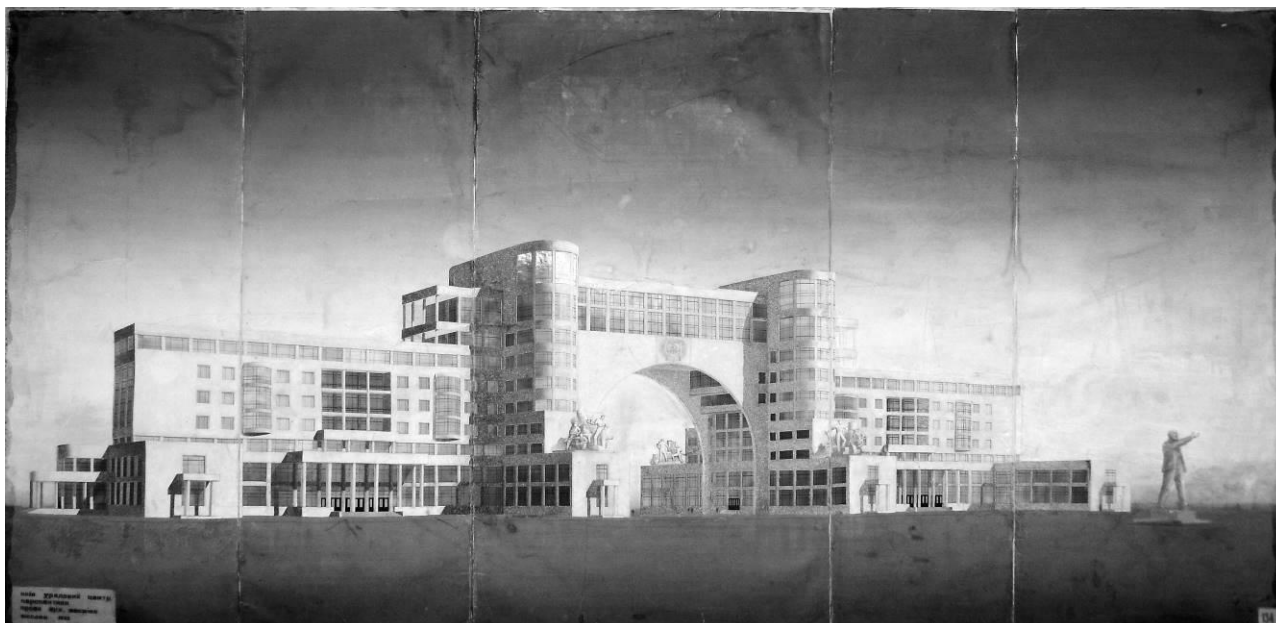
Іл. 3. РНК і ЦК КП(б)У, перспектива. Перший конкурс. 1935 р.

завширшки і більш як 600 завдовжки [7]. Варто зазначити, що, на відміну від двох попередніх проектів, завданням на будівництво яких передувала детальна інженерно-конструкторська підготовка, конкурс на забудову Урядового кварталу включав ряд принципових вимог стосовно містобудівного та образного вирішення споруд, залишаючи технічні питання на другому плані.