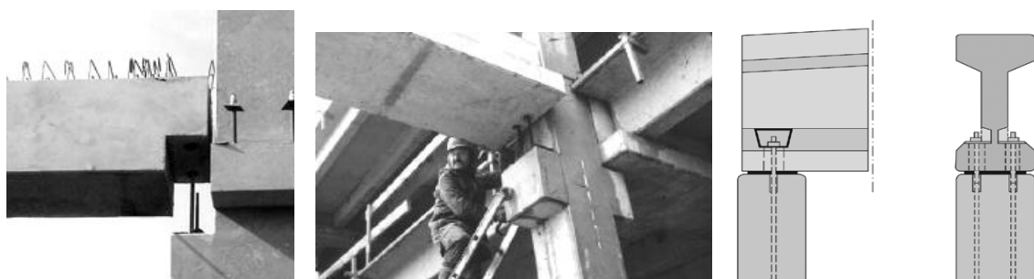
Рис. 2. Варіанти спирання балок на колони

Номенклатура лінійних горизонтальних конструкцій (балок) ( f_2 ) більш різноманітна (рис. 2). Випускаються балки прямокутного перерізу, таврові, двотаврові. Ширина 300 ... 1200 мм, висота 400 ... 1600 мм і довжина до 30 м. Стикові з'єднання на консолях колон комбінованого типу ( d_1 \cup d_2 ), а на оголовках колон болтового типу ( d_1 ).