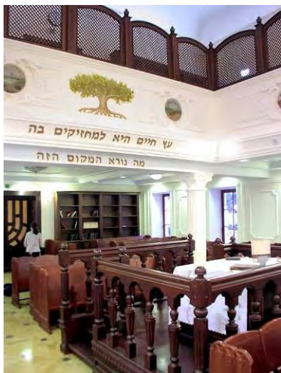
Рис. 5. Біма синагоги в Києві

Обов'язковим елементом у молитовному залі синагоги є ряд сидінь (лав), перед якими возвеличується Арон-кодеш. У центрі залу, як правило, розміщують Біму для читання Тори, що може являти собою підвищену трибуну прямокутну, або багатокутну (восьмиграну) в плані, огорожену декоративною огорожею із дерева (рис. 5), металу (синагога у м. Жовква). Біма може бути