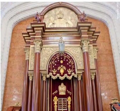
Рис.2. Арон-кодеш синагоги Бродського у Києві

Планувальна композиція синагоги підпорядкована домінантній осі: вхід – Біма – Арон-кодеш, що орієнтується на Єрусалим. Синагога має три ключові складові: Арон-кодеш, Біму і зал для молитви та зборів. Таким чином, можна стверджувати, що основними елементами споруди, безумовно, є вівтарна частина і зал для молитви. Інтер'єр залу формують Арон-Кодеш біля східної стіни (івр. «святий ковчег»), Біма, з якої читають Тору (івр. «кафедра»). Арон-кодеш та Біма за традицією вирішувались як святилища.