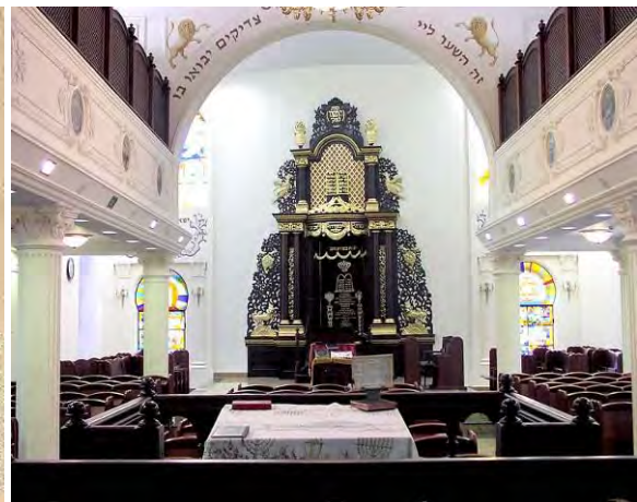
Рис. 4. Синагога на вул. Щекавицькій, м. Київ

Арон-кодеш розташовують на підвищенні, огороженому дерев'яною або металевою балюстрадою. Він складається із ніші або “шафи” зі звитком Тори (Святая Святих) і вівтарної стіни. Арон-кодеш, що являє собою вівтарну нішу для зберігання звитків Тори, зазвичай пластично вирішується у вигляді порталу та декорується єврейською символікою, рис.3. Він може бути кам'яний, мармуровий, дерев'яний. Арон-кодеш у великих синагогах, як правило, складної форми (триярусна брама), яка формується рослинним орнаментом із фігурами тварин і птахів. Ніша для зберігання Трои, фланкується з обох боків колонами, оздобленими рослинними мотивами (гілками, лозою), що символізує дерево життя, і зазвичай знаходиться у нижній частині Арон-колеш, рис. 4. У другому ярусі розміщують скрижалі Завіту із десятьма заповідями. Композиція Арон-кодеш завершується “корною Тори”, або двоголовим орлом з короною і пальмовими гілками — символ Царя Небесного, рис. 2. Верхню частину Арон-кодеш сучасних ортодоксальних синагог Литви та Польщі прикрашають зображеннями скрижалей, які підтримують з обох боків леви та короною, що увінчує загальну композицію.