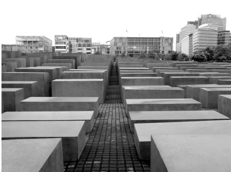
Рис. 2. Меморіал знищеним євреям Європи, м. Берлін, Німеччина, арх. П. Айзенман, 1988-2005 рр.

в 1998–2001 рр. перетворив колишній палац з'їздів нацистської партії архітектора А. Шпеєра, наочно виражає гнів, спрямований на знехтувану ідеологію минулого (рис. 3).