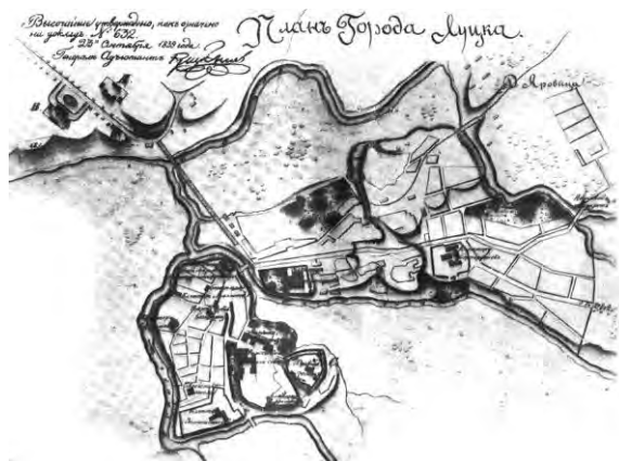
Рис. 1. План міста Луцька 1839 року

Власне, просторова розбудова м. Луцька ґрунтувалася на стратегіях формування комунікаційних і транспортних мереж, економічному та туристичному просуванні окремих містобудівних структур. Зокрема, у міжвоєнний період містотвірним акцентом стала транспортна мережа міжміського сполучення, тобто шосе Київ – Брест, простір вздовж якого заповнювався архітектурними об'єктами освітнього, комерційного, громадського призначення. Естетична виразність, насичення плоских фасадів декоративними елементами та відображення стилістичних напрямів в архітектурних рішеннях будівель підвищувало конкурентоспроможність розташованих тут закладів (рис. 2.).