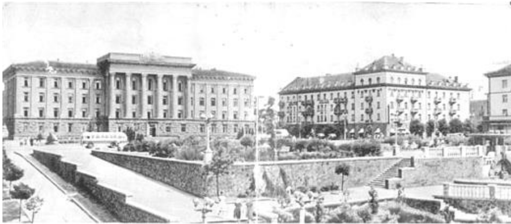
Рис. 3. Ансамбль Університетської площі (центр міста). Фото 1960-х років.

У другій половині 50-тих років ХХ ст., через загострення житлової кризи малоповерхове приватне та індивідуальне будівництво поступово згоралося, на зміну якого масово поширилось зведення уніфікованих багатоповерхових будівель на основі серійних типових проєктів (рис. 4). При забудові кварталів перевага надавалася симетричному розташуванню житлових груп відносно міських магістралей (сучасних пр. Соборності, вул. Відродження та пр. Молоді), із композиційним поєднанням типових цегляних та крупнопанельних будинків різної поверховості та форми. Для урізноманітнення виразності внутрішнього простору мікрорайонів, використовувалася забудована тільки рядовими секціями, а також кутовими, блокованими, ламаними в плані, хрестоподібними будинками, будівлями-вставками та будинками баштового типу.