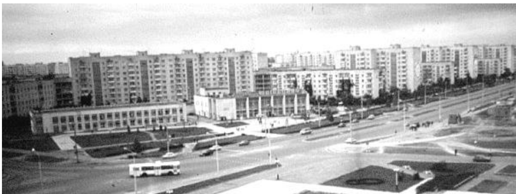
Рис. 4. Забудова Завокзального району міста. Фото 1980-х років

Переломний політичний момент в житті країни, який відбувся у 1991 році, супроводжувався посиленням кризових явищ у економіці. Соціально-економічні реалії найповніше відобразились у житлово-комунальній сфері та містобудуванні. Через відсутність державного замовлення майже повністю припинилось будівництво житлових масивів забезпечених різнобічними функціями. Орієнтування архітектури перших пострадянських років