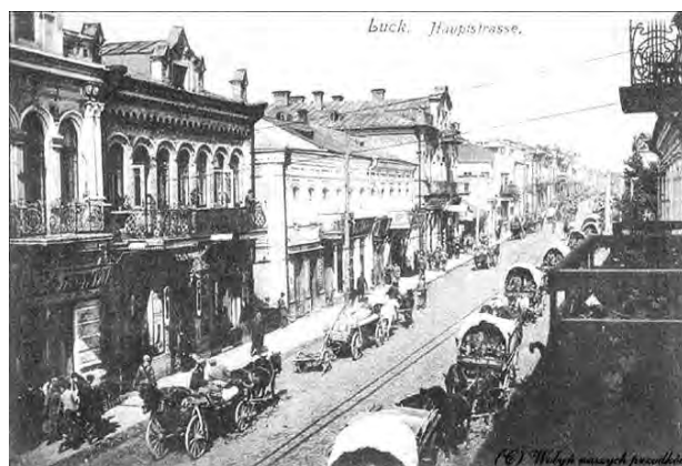
Рис. 2. Вулиця Шосейна (транспортна мережа міжміського сполучення – шосе Київ – Брест). Сучасна вул. Лесі Українки

Важливий поворот у політичній історії Луцька, який відбувся у 1939 році, докорінно змінив концепції розвитку усіх сфер міської життєдіяльності та просторового розвитку. В основі стратегії повоєнного розвитку була розбудова прилеглих територій, включення їх до складу міста, апріоритетними завданнями стали: розширення житлового фонду, трасування нових комунікаційних мереж, утворення адміністративних та громадських центрів, благоустрій міської території.