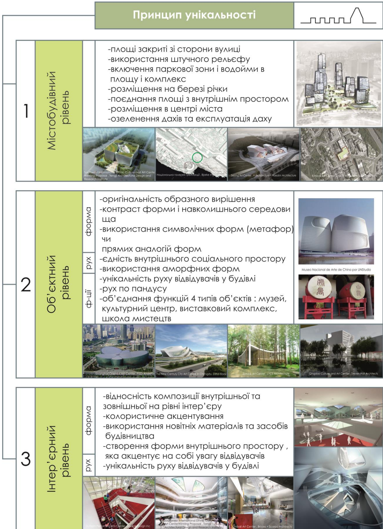
Рис.3. Принцип унікальності в формуванні арт-центрів та прийоми його реалізації