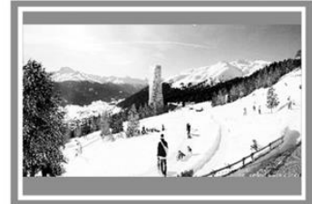
Готель «Шанцль-Тауер», Швейцарія, Давос