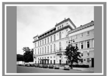
Готель «Островський», Росія, Санкт-Петербург