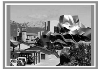
Готель «Маркес де Ріскаль», Іспанія