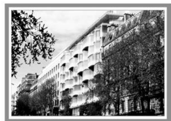
Готель «Ренесанс», Франція, Париж