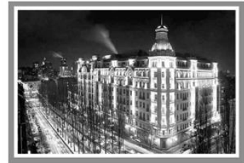
Готель «Прем'єр-Палас», Україна, Київ