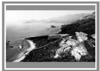
Готель «Монтенегро», Чорногорія