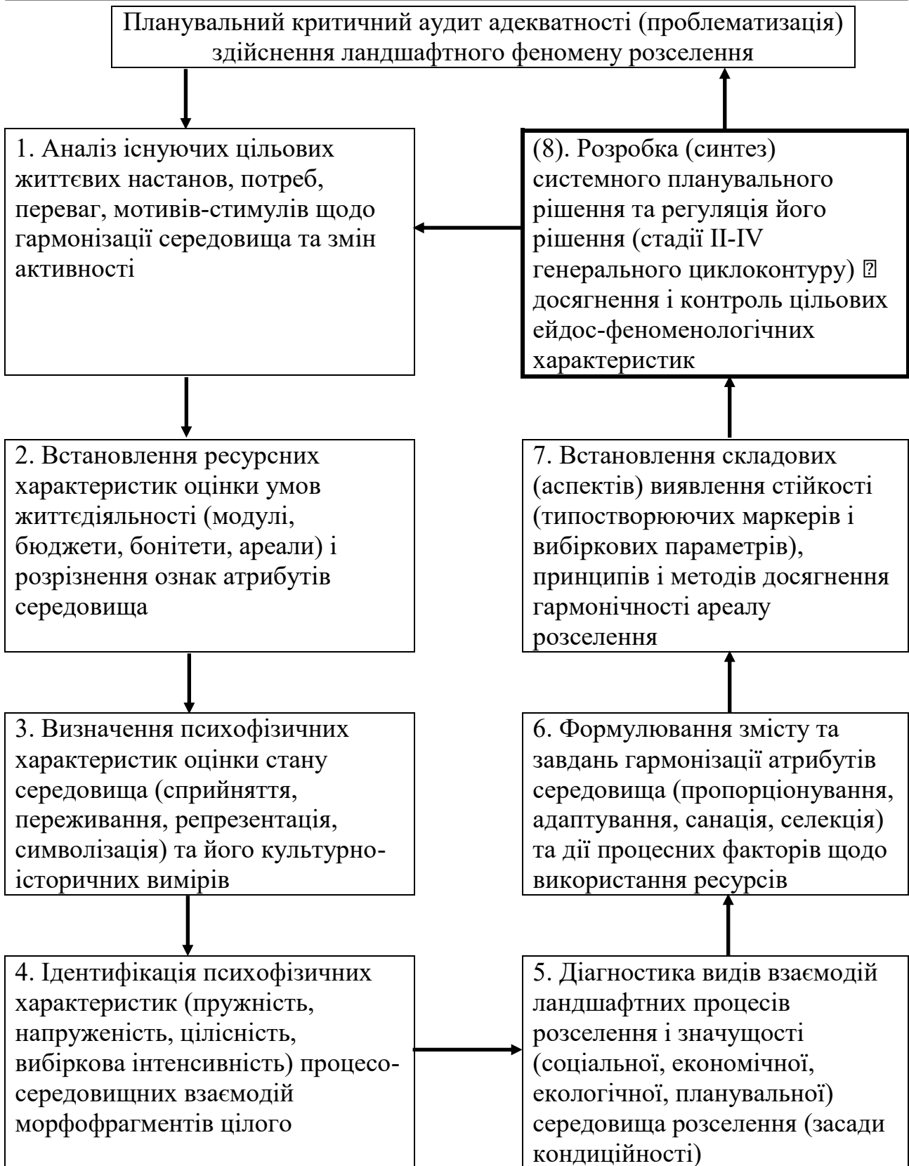
Рис.2 Змістовні етапи феноменологічної стадії розробки планувальних рішень поселень (стадія I рисунку 1)