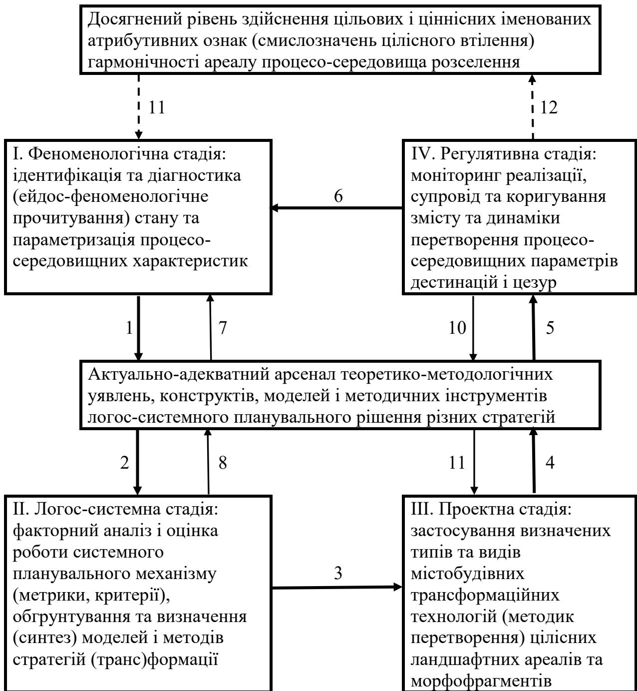
Рис.1 Генеральний циклоконтур розробки планувального рішення (1-6), методичного оснащення (7-10) та планувального аудиту (11,12) - логіко-семантичний каркас стратегій розробки та прийняття містобудівних планувальних рішень стосовно гармонічних (транс)формацій ареалів розселення (поселень)