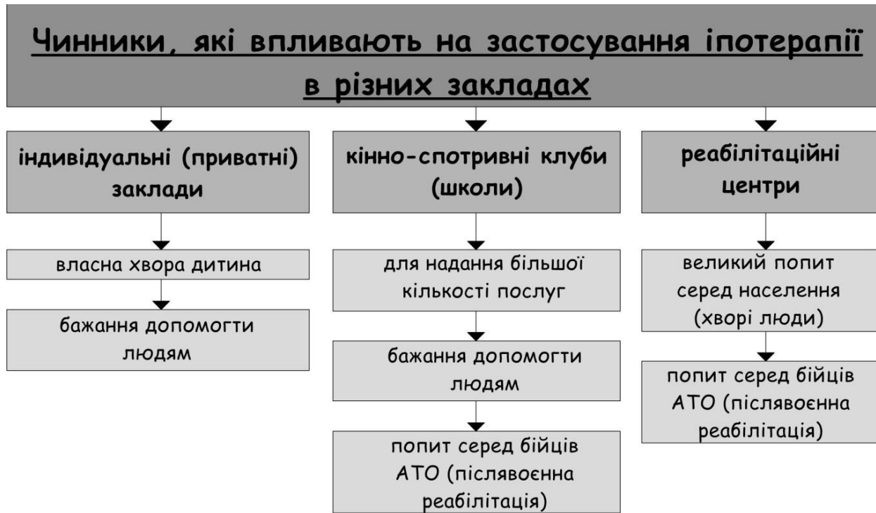
Рис. 3. Чинники, які впливають на застосування методу іпотерапії