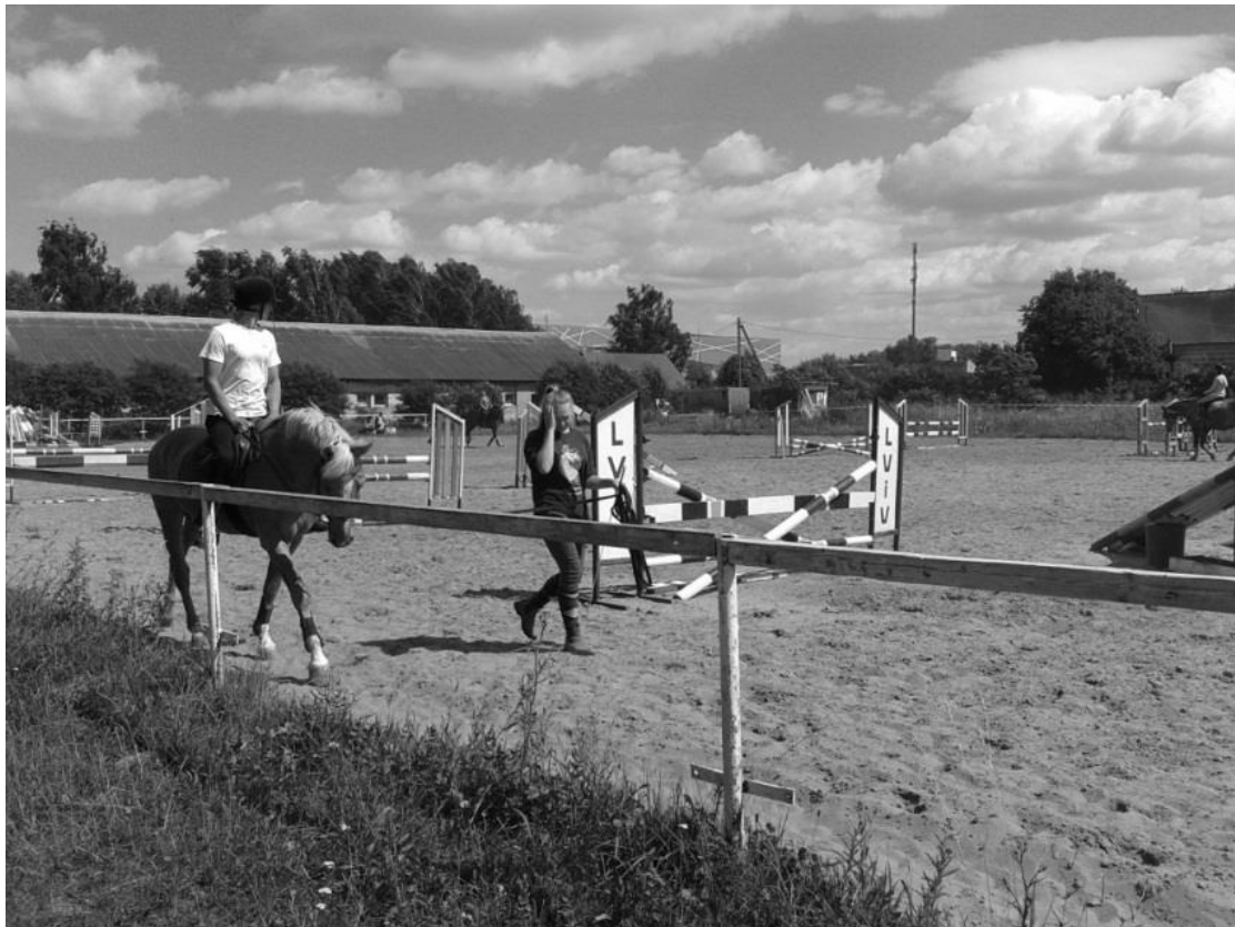
Рис. 4. Фотофіксація іподрому м.Львів