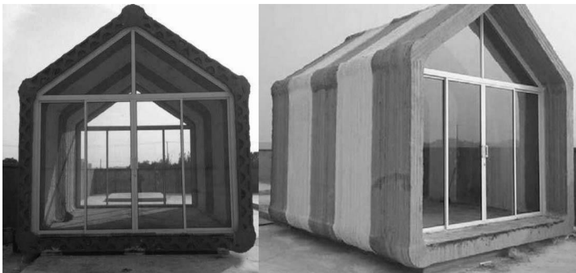
Мал. 1. Перші надруковані будівельні об'єкти поблизу Шанхаю, Китай.

У 1986 році було зібрано перший в світі стереолітографічний 3D-принтер, завдяки чому цифрові технології зробили величезний крок вперед. Приблизно в той же час з'явився перший в світі FDM-апарат. З тих пір, ринок тривимірного друку став стрімко зростати і поповнюватися новими моделями унікального друкарського обладнання. В 1995 студенти Массачусетського технологічного інституту, Джим Бредт і Тім Андерсон, впровадили технологію пошарового синтезу матеріалу в корпус звичайного настільного принтера. Метод створення об'єкту шляхом пошарового додавання сировини назвали адитивним. Так 3D друк став доступний у побуті та мобільний.