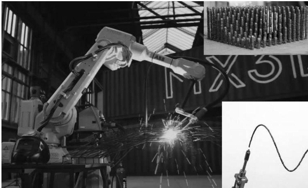
Мал. 4. Зварювальний газовий напівавтомат для 3D друку металевих конструкцій «MX3D», Амстердам, Нідерланди.

Слід зауважити, що наявність в конструкціях польових фортифікаційних споруд обов'язкових металевих елементів для опору впливу вибухової хвилі, теж може бути вирішено за рахунок металевого 3D друку. За для цього можливе використання принтеру, що працює за принципом зварювального газового напівавтомату, екструдер якого керується «роботизованою рукою». Такий підхід в сфері 3D друку досліджують інженери «MX3D» у Амстердамі, Нідерланди. (Мал. 4).