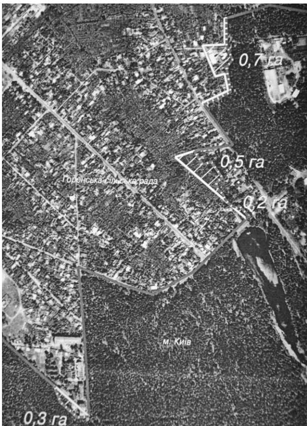
Рис. 1. Землі Київської міської ради, які передаються у відання Горенської сільської ради

З метою виконання вказаних заходів заплановано збільшення території міста на 2075,7 га за рахунок земель Київської області, включення до меж м. Києва селища Коцюбинське Ірпінської міськради, площею 87,0 га земель, та передача Київській області 659,3 га земель [7]. Зауважимо, що у розрізі цього проектними пропозиціями щодо зміни меж м. Києва передбачена передача з відання Київської міської ради у відання Горенської сільської ради 1,2 га земель житлової забудови (рис. 1) та передача 0,9 га сільськогосподарських земель із відання Лісниківської сільської ради у відання Київської міської ради (рис. 2).