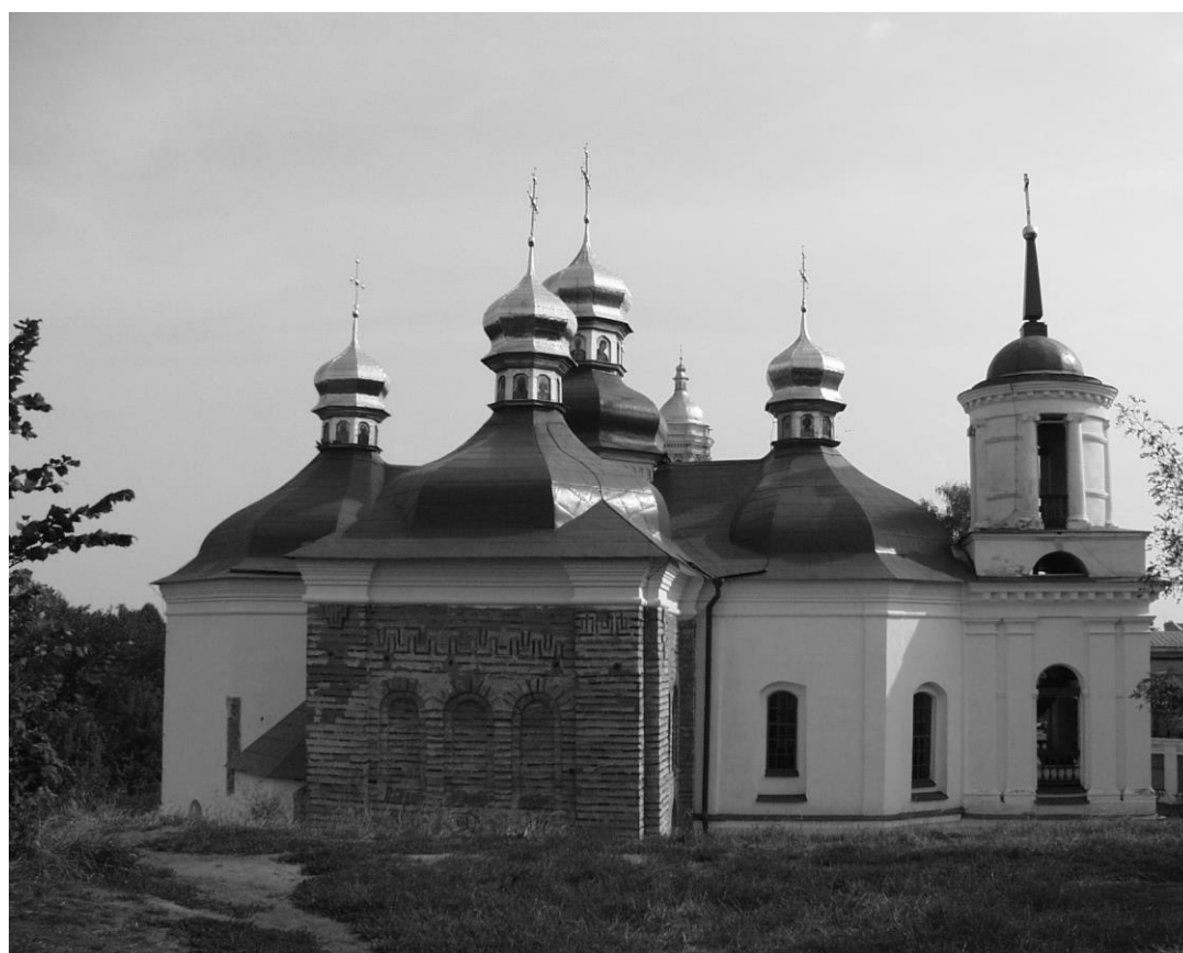
Рис. 3. Північний фасад з земляного валу