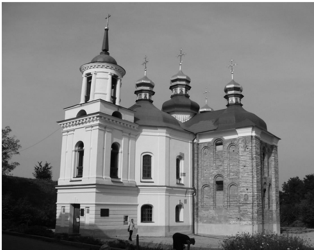
Рис. 2. Вигляд церкви з південно-західного боку