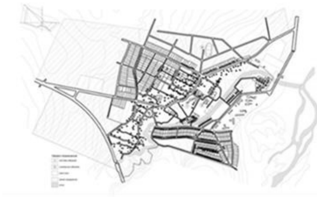
Рис. 2. Генплан 80-х років с. Чукалівка Тисменицького р-ну Івано-Франківської обл..

На основі співставлення результатів натурних досліджень окремих сіл із розробленими у 70-90 роках ХХ ст. генпланами, було з'ясовано, що практично завжди в забудові сіл можна знайти суттєві відхилення від їх запроєктованих, погоджених і затверджених генпланів. В першу чергу це стосується повноти реалізації громадських споруд, діляниць сільбищної території, спортивних та рекреаційних зон, вуличної мережі поселень.