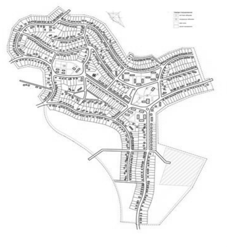
Рис.3. Генплан 80-х років с. Ардоново Іршавського р-ну Закарпатської обл.

Так у селі Ардонове Закарпатської області, замість пропонованої ущільненої забудови в центральній частині села, сформувався новий квартал неподалік села.