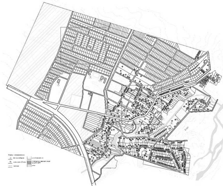
Рис.7. Генплан с. Чукалівка Тисменицького р-ну Івано-Франківської обл. станом на 2014 рік.

У світовій практиці поняття багатофункціонального розвитку сільських територій тісно пов'язано зі збільшенням частки несільськогосподарських видів діяльності. Досвід зарубіжних країн вказує на зростання багатоукладної економіки усіх видів діяльності на сільських територіях, як альтернативних джерел доходів та передумов до подальшого розвитку окремих місцевостей.