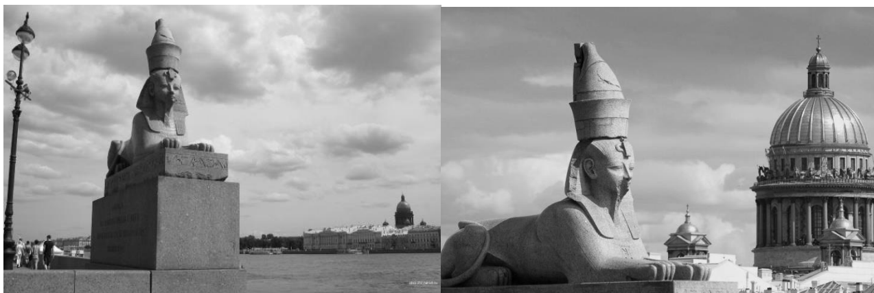
Рис.2. Сфінкси з Луксорського храму (м. Санкт-Петербург, Росія).

Багато досягнень єгиптян лягли в основу античного мистецтва. Надалі внесок Стародавнього Єгипту в культуру Європи був дещо призабутий. І тільки наполеонівський похід і зроблені під час нього знахідки, що дозволили Франсуа Шамполіону розшифрувати ієрогліфи, відкрили здивованому світові точку відліку багатьох досягнень єгипетської цивілізації [2]. І навіть в далекому Санкт-Петербурзі на набережній перед академією мистецтв були встановлені знамениті сфінкси з Луксорського храму, що уособлювали Аменхотепа III [1].