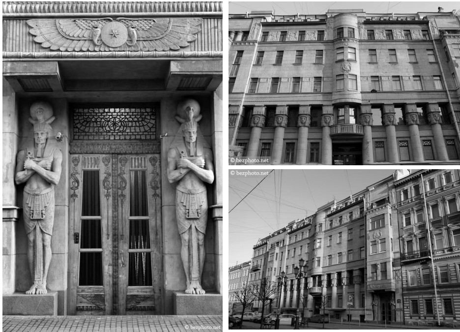
Рис.3. Єгипетський дім (м. Санкт-Петербург, Росія)

Петербург розташований в точці середньої лінії трикутника, що з'єднує Велику піраміду Єгипту, піраміду в мексиканському храмовому комплексі Тіуанако і північний полюс. Цим фактом пояснюється велика кількість стародавніх містичних знаків єгипетської, а, можливо, і значно більш давньої культури в Санкт-Петербурзі.