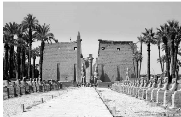
Рис.1. Єгипет: а) Храм Абу-Сімбел; б) Луксорський храм

Єгипет був першою країною в історії людства, де уявлення про простір та форму, освячені звичаєм, стали переважати над життєвою доцільністю. В результаті, перемогло усвідомлення художнього оформлення та стилю.