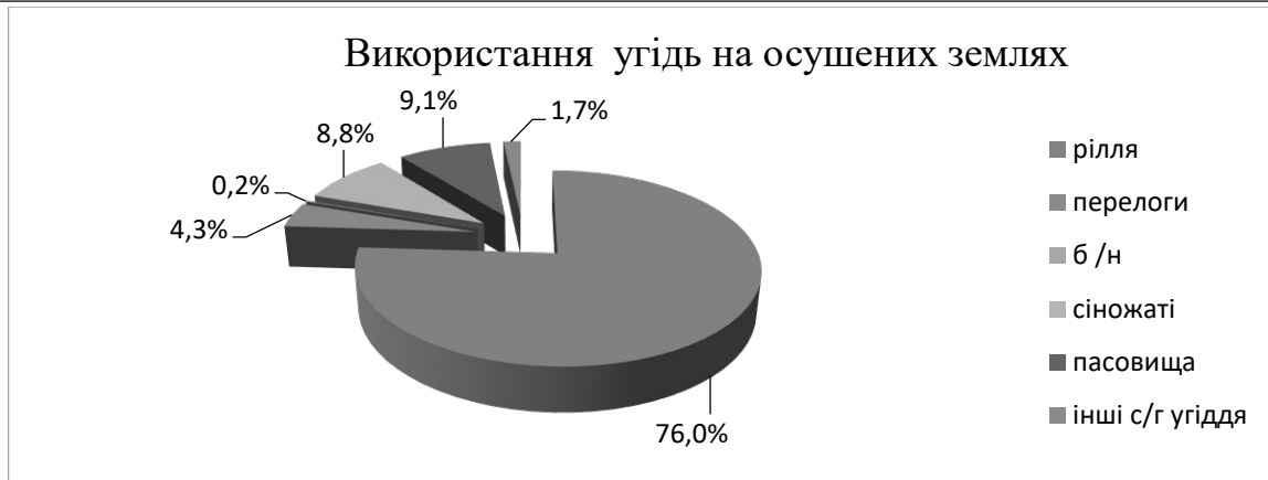
Рис. 1. Використання угідь на осушених землях Житомирської області