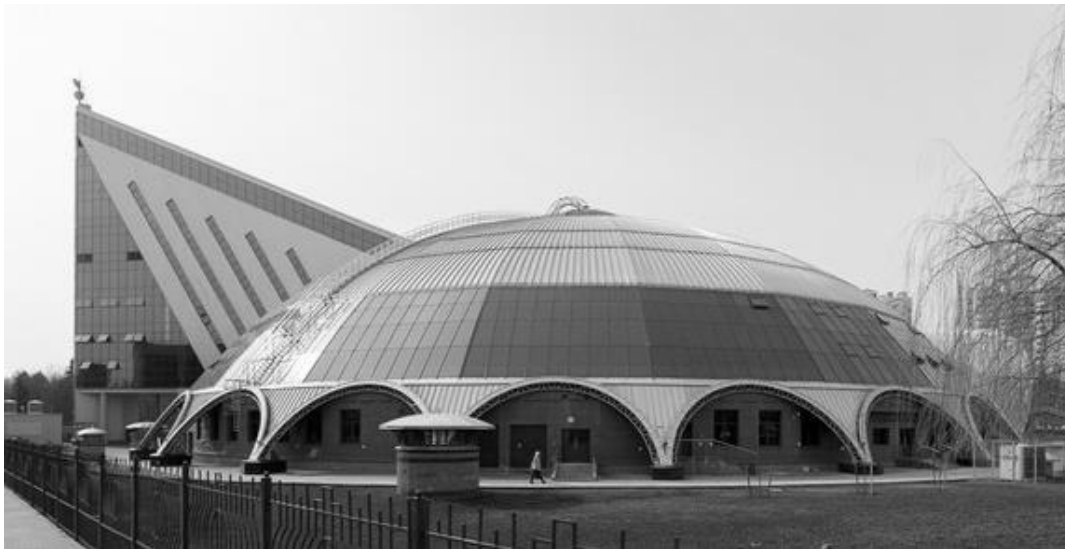
Рис.1. Архітектурне рішення центру водного фрістайлу: купольне покриття та гірка зі спортивними трамплінами

Відомо, що сталеві конструкції сучасних великих куполів прольотом до 125 м виконуються переважно як одношарові сітчасті або ж як просторові структурні оболонки [5]. Однією з таких споруд є сучасний центр водного фрістайлу у м. Мінську, Республіка Беларусь (рис.1). Серед можливих просторових схем куполів: ребристої, ребристо-кільцевої, сітчастої, – обрана наскрізна ребристо-кільцева схема, в якості кілець якої виступають тригранні просторові ферми.