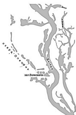
Рис.3. Вигляд системи озер на період 2005 року.