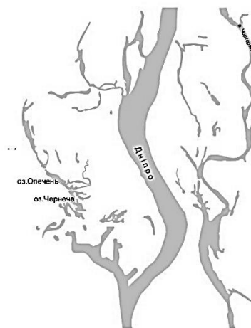
Рис.2. Схема розподілу річки Почайна на період 1943р.