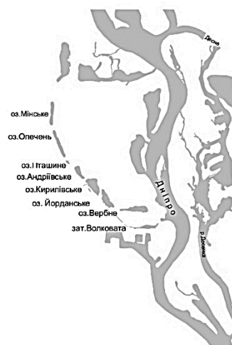
Рис.4. Схема системи озер Опечень та р. Почайна на період 2016 року.