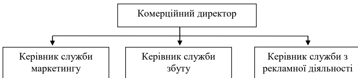
Рис. 1. Схема функціональної організації служби збуту