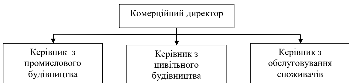
Рис. 3. Схема товарної організації служби збуту

Товарний тип організації управління збутом більше всього застосовний для універсальних будівельних фірм, що проводять широкую номенклатуру будівельної продукції.