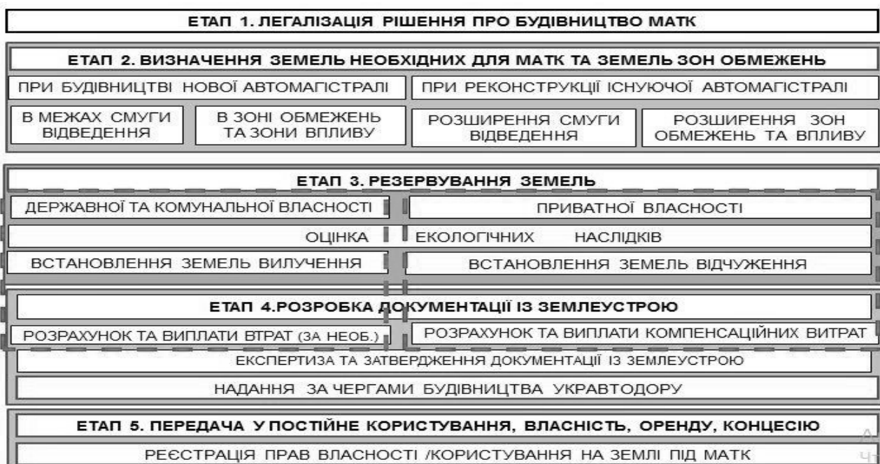
Рис.2. Технологічна модель надання земель під міжнародні автомобільні транспортні коридори

конфігурації та значної протяжності для розташування об'єктів МАТК. Об'єктом ПР є існуючі МАТК, автомагістралі яких потребують реконструкції, та намічені для будівництва нові напрямки. Резервні смуги створюються з метою виконання нормативів для здійснення будівництва автомагістралей з додержанням екологічних, соціальних і економічних норм. Підставою для резервування є затверджені матеріали територіального планування – Генеральна схема планування території України та автодорожнього проектування – техніко-економічне обґрунтування проходження автомагістралі МАТК.