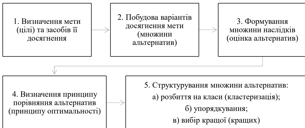
Рис. 1. Схема прийняття рішень при проектуванні покриття будівлі

Загальну схему прийняття рішень при проектуванні покриття будівлі можна описати в такому вигляді схеми наведеної на рис. 1. Кожен блок 1 – 5 наведеної схеми потребує конкретизації та певної формалізації. Задача із заданою множиною альтернатив і принципом оптимальності є загальною задачею оптимізації, зміст якої полягає у виділенні множини кращих альтернатив. При умові, що принцип оптимальності задається множиною критеріальних функцій, необхідно розв'язувати задачу багатокритеріальної оптимізації [15].