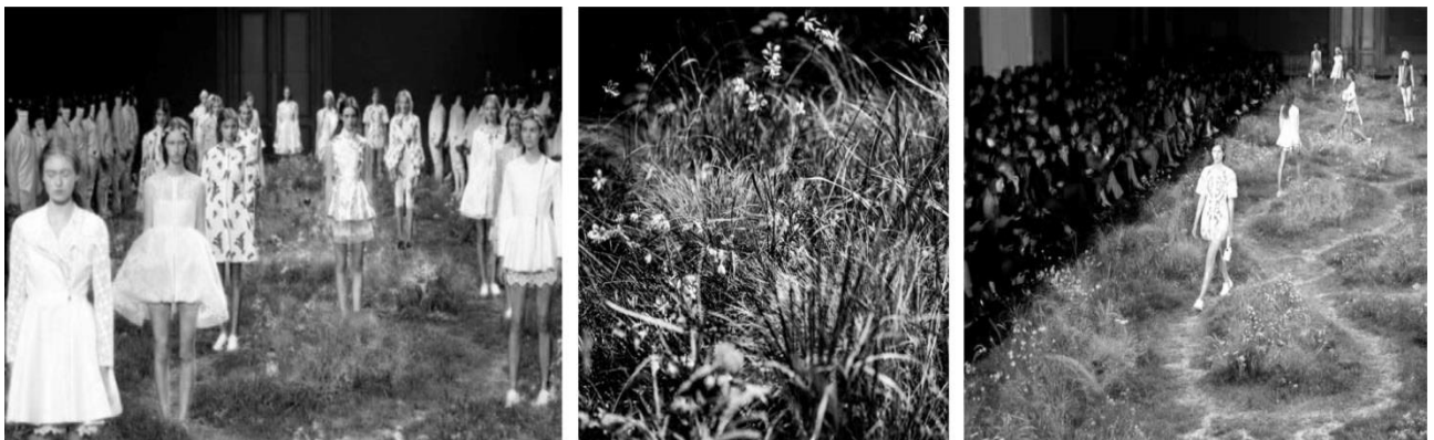
Рисунок 2. Показ Moncler Gamme Rouge весна-літо 2016, Париж.

Показ мод Moncler Gamme Rouge в Парижі (рис. 2) пройшов на подіумі вкритому травою, злаками та польовими рослинами, колекція одягу демонструвала легкі весняно–літні фасони суконь, що були підкреслені вишуканим вирішенням площини подіумного покриття. В показі з колекції Dior Олександр де Бетак створює імпровізацію природного утворення — гори вкритої квітами. В першому випадку застосовано прийом використання ґрунту та рослинності, в другому, імітація природних утворень. Також, автор виділяє такі прийоми використання озеленення в вирішенні подіумного простору: покриття горизонтальної поверхні мохом (Dries van Noten, Париж, 2015 рік); озеленення групами чагарників (Dior, Париж); оздобленні вертикальних площин квітами (Dior, Париж); використання вертикального озеленення; ампельні рослини на стелі (Олександр де Бетак, Dior, Париж).