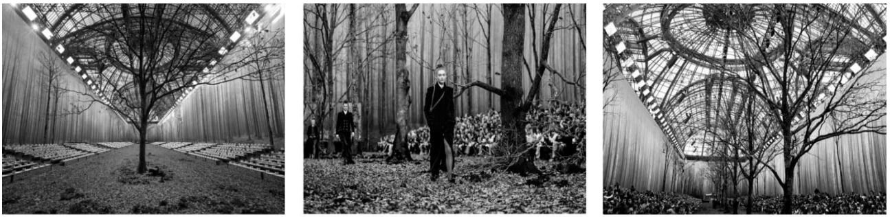
Рисунок 1. Дизайн подіумного простору в Гран-Пале, Париж, показ Chanel осінь-зима 2018/19.

Показ мод Moncler Gamme Rouge в Парижі (рис. 2) пройшов на подіумі вкритому травою, злаками та польовими рослинами, колекція одягу демонструвала легкі весняно–літні фасони суконь, що були підкреслені вишуканим вирішенням площини подіумного покриття. В показі з колекції Dior Олександр де Бетак створює імпровізацію природного утворення — гори вкритої квітами. В першому випадку застосовано прийом використання ґрунту та рослинності, в другому, імітація природних утворень. Також, автор виділяє такі прийоми використання озеленення в вирішенні подіумного простору: покриття горизонтальної поверхні мохом (Dries van Noten, Париж, 2015 рік); озеленення групами чагарників (Dior, Париж); оздобленні вертикальних площин квітами (Dior, Париж); використання вертикального озеленення; ампельні рослини на стелі (Олександр де Бетак, Dior, Париж).