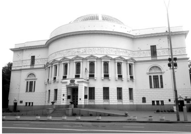
Рис. 8. Будинок Педагогічного музею в Києві. Арх. П.Ф. Альошин, 1911 – 1913 рр.