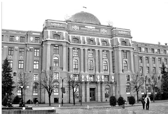
Рис. 11. Будинок Ууправління Південної залізниці в Харкові. Арх. О.І. Дмитрієв, гр. інж. Д.С. Ракітін, інж. П.П. Роттерт, 1912–1914 рр.

громадські будівлі. Приклади: прибутковий будинок страхового товариства «Росія» на Павлівській пл. (Арх. І.О. Претро, 1914 - 1916 рр.), прибутковий будинок страхового товариства «Саламандра» на вул. Сумської № 17, що має складну просторову композицію, виходячи на дві вулиці (арх. М.М. Верьовкін, 1913 - 1916 рр., будівля Управління Південних залізниць на Привокзальній площі (арх. О.І. Дмитрієв, Д.С. Ракітін, інж. П.П. Роттерт, 1913 р., рис. 11) [29].