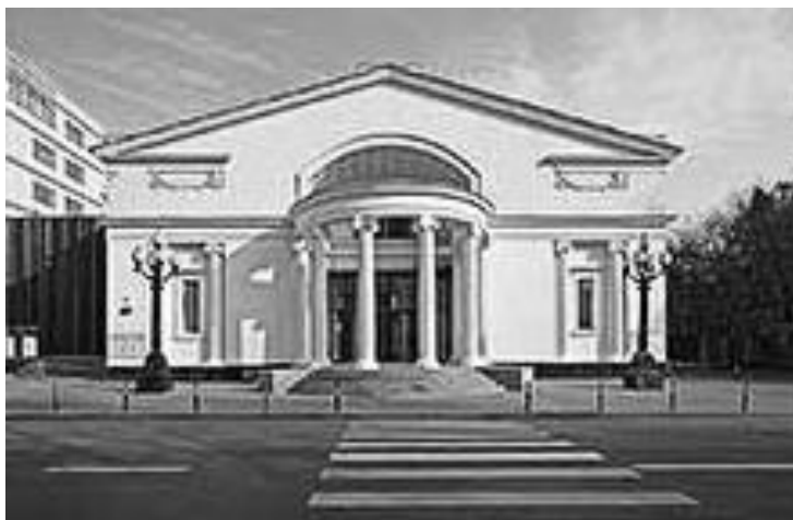
Рис. 4. Будинок кінотеатру «Колізей» в Москві. Арх Р.І. Клейн, 1913 – 1914 рр.

архітектурі кінематографа (будівля кінотеатру «Асамблея» А.Е. Медведєва в Петербурзі (арх. Ф.А. Корзухин, 1913 р.), будівля московської хоральної синагоги (арх. С.С. Ейбушиц, 1886 р.) театру в Ярославлі (арх. Н.О. Спірін, 1915 г.), нового кам'яного театру в Ялті (арх. Л.М. Шаповалов, 1908 р.), кінотеатру «Колізей» в Москві (арх. Р.І. Клейн, рис. 4).