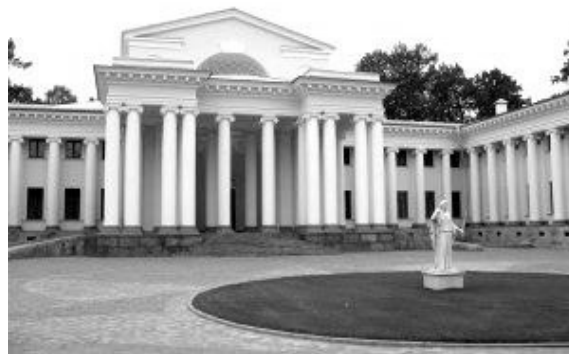
Рис. 3. Особняк-палац графа О.О. Половцова на Кам'яному острові в Санкт-Петербурзі. Арх. І.О. Фомін, 1912 – 1916 рр.

Національно-патріотичне звучання неокласики вперше проявилось в виставковому павільйоні Росії на виставці в Турині (арх. В.О. Щуко, 1911 г.), прототипом для якого послужила будівля Кінного двору в Кузьмінках (арх. Д. Жиллярді). З'явився неокласицизм і в особняках, побудованих за проектами архітекторів І.О. Фоміна, М.Г. Лазарева, А.О. Гунста, Ф.О. Шехтеля, В.О. Покровського, А.А. Оля, В.Д. Адамовича та ін. (приклад: особняк-палац графа О.О. Половцова на Кам'яному острові в Санкт-Петербурзі (рис. 3) [5].