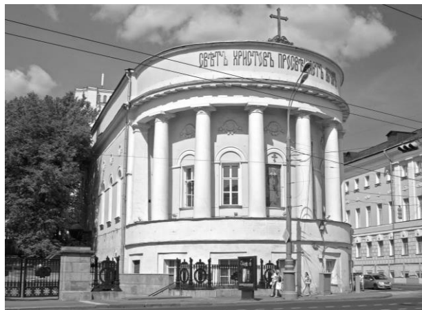
Рис. 1. Церква Св. Татіани при Московському університеті. Арх. Є.Д. Тюрін, 1836 р.

Наявність в той час літератури і навчальних посібників з питань ордерних систем та способів пропорційних побудов свідчить про те, що антична традиція в архітектурі з 1830-х рр. до початку ХХ-го століття не переривалося [20,21,22].