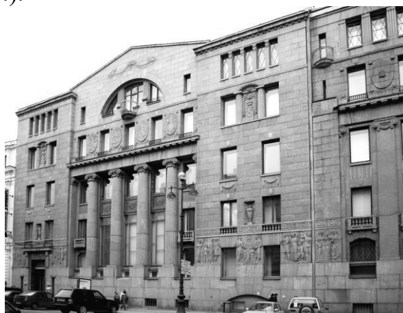
Рис. 5. Будинок Азовсько-Донського банку в Санкт-Петербурзі. Арх. Ф.І. Лідваль, 1907 – 1913 рр.

Поступово виробилися характерні для нової класики композиційні прийоми: укрупнення членувань фасаду за допомогою «термальних» вікон у великих фронтонах, які були продовженням стіни і не відділялися від неї карнизом (їх вперше ввів арх. Ф.І. Лідваль в будівлі Азовсько-Донського банку в Санкт-Петербурзі, рис. 5), розподіл великого фасаду на три частини, виділення його композиційного центру і фланкування бічних частин ризалітами, при цьому центральна частина і ризаліти підкреслювалися колонними портиками (приклади - будівля Комерційного інституту, 1901 - 1904 рр., будівля Вищих жіночих курсів на дівочому Полі в Москві, 1913 р. (арх. С.У. Соловйов, рис. 6.).