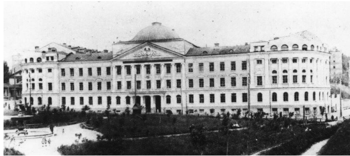
Рис. 9. Будинок Жіночого університету Святої Ольги в Києві. Гр. інженер. О.В. Кобелев, 1911 – 1913 рр.