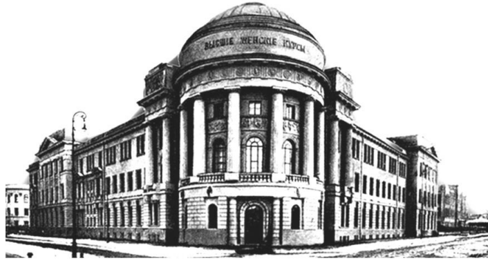
Рис. 6. Будинок Вищих жіночих курсів на Дівочому Полі в Москві. Арх. С.У. Соловійов, 1913 р.

Цей прийом набув поширення в архітектурі навчальних закладів. Характерним було також виділення кута будівлі на перетині вулиць великою ордерною ротондою.