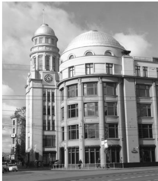
Рис. 7. Будівля Північного Страхового товариства в Москві. Арх. І.І. Рерберг, М.М. Перетяткович, В.К. Олтаржевський, І.О. Голосов, 1909 – 1911 рр.

Незважаючи на початкове протистояння неокласицизму і модерну, між ними відбувалися взаємовпливи. Так, в неокласицистичних будівлях використовувалися асиметричні композиції об'ємів, великі еркери і укрупнені віконні отвори з великими площами скління. Деякі будівлі мають взагалі проміжну стилістику між неокласицизмом та модерном. Приклад: будівля Північного Страхового товариства в Москві (арх. І.І. Рерберг, М.М. Перетяткович, В.К. Олтаржевський, І.О. Голосов, рис. 7).