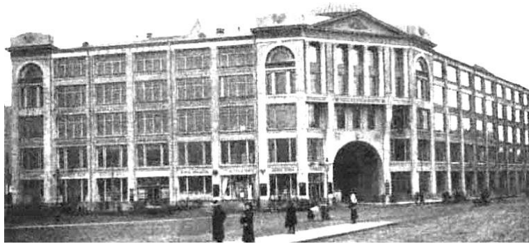
Рис. 10. Комплекс будівель «Діловий Двір» в Москві. Арх. І.С. Кузнєцов, 1911 – 1913 рр.

Після революції 1917 р. архітектори-неокласицисти продовжували творити, хоча вже і в стилі «пролетарської класики» (І.О. Фомін, І.В. Жолтовський, Н.А. Троцький та ін.).