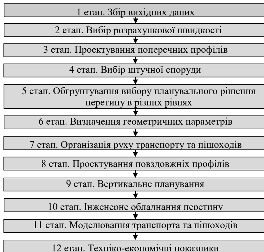
Рис. 1. Етапи проектування перетинів міських магістралей в різних рівнях

Перетин міських магістралей в різних рівнях представляє просторову структуру площ та перехресть, яка з допомогою штучних споруд дозволяє ефективно пропустити через вузол конфліктуючі потоки транспорту та пішоходів [3]. Містобудівна практика визначає 12 етапів проектування перетинів міських магістралей в різних рівнях (Рис. 1).