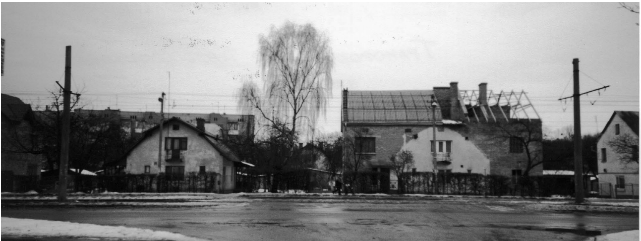
Рис. 2 Трансформація малоповерхової забудови 1950-их років на вул. Княгині Ольги у Львові станом на 2004 рік. Ліворуч одноповерховий будинок з мансардою, який поки що зберіг первісний вигляд; праворуч – такого ж типу будинок тільки з добудовою і надбудовою, контури старого фасаду ще проглядаються

Львів перетворюється у крупний промисловий і культурний центр Радянської України. Для здійснення реконструкції та благоустрою міста за генеральним планом, розробленим Діпромїстом і затвердженим постановою Ради Міністрів УРСР в 1956 році, розподіляється на зони : багатоповерхову (чотири – п'ять) поверхів, малоповерхову (два – три поверхи і одноповерхову, розраховану в основному на індивідуальне будівництво. У 1957 році у Львові розгорнулося масове спорудження одноповерхових з мансардою і двоповерхових будинків. Ділянки цього будівництва відведено в зонах малоповерхової забудови в основному великими масивами недалеко від промислових підприємств.