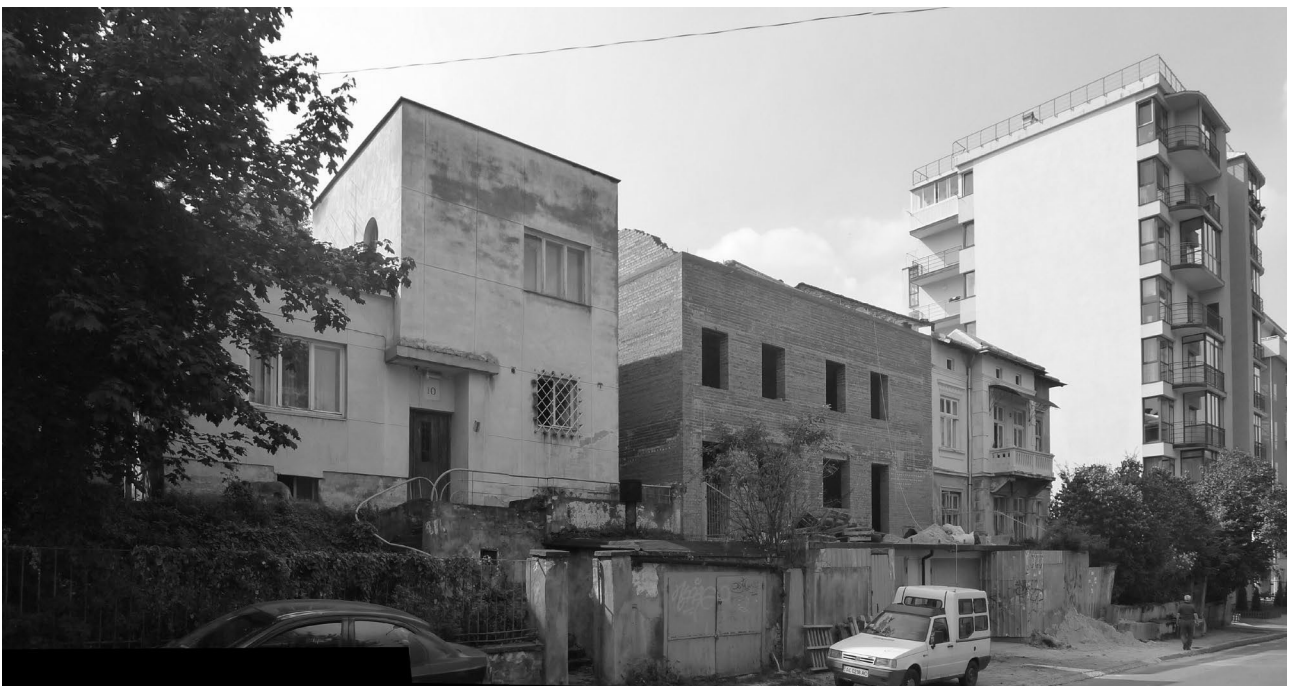
Рис. 3 Архітектурно-просторові трансформації історично сформованої віллової забудови на вул. Погулянка. Багатоповерхова забудова та добудова історичних вілл за рахунок прибудинкових садів назавжди порвали простір колись романтичної Погулянки.

Певна кількість двоповерхових будинків – кожен окремо або групами – по два–три і навіть чотири – з’явилися на вільних ділянках у різних районах міста. Нове житлове будівництво з високим рівнем інженерного обладнання сприяє поліпшенню благоустрою робітничих околиць. Так, наприклад, завдяки розміщенню крупних масивів нового будівництва на околицях міста – Левандівка перетворюється в благоустроєне селище. На відміну від довоєнного періоду забудова проводиться за типовими проектами будинків, розробленими Львівською філією Діпромiста.