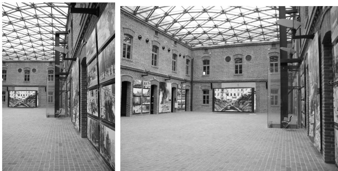
Rys.2. Przeszkłone zadaszenie wewnętrznego dziedzińca Muzeum AK w Krakowie (Autorzy: D. Kuśnierz-Krupa, J. Kobylarczyk, K. Paprzyca) Rys.3. Ekspozycja w wewnętrznym dziedzińcu Muzeum AK w Krakowie (Autorzy: D. Kuśnierz-Krupa, J. Kobylarczyk, K. Paprzyca)

Sam powojkowy obiekt – nowa siedziba Muzeum uległ modernizacji trwającej od 2009r. do 2011 r. Projekt rewaloryzacji oraz całej adaptacji został wykonany przez pracownię AIR Jurkowsy Architekci. Fasadę poddano renowacji poprzez oczyszczenie cegieł, wymianę stolarek okiennych oraz przebudowanie wnętrza Muzeum. Największą ingerencją było zadaszenie całego dziedzińca. Nowy budynek Muzeum został nagrodzony w konkursie Brick Award; był też nominowany do Mies van der Rohe Award oraz wyróżniony w Konkursie SARP na najlepszy obiekt architektoniczny w Polsce 2011 roku 12 .