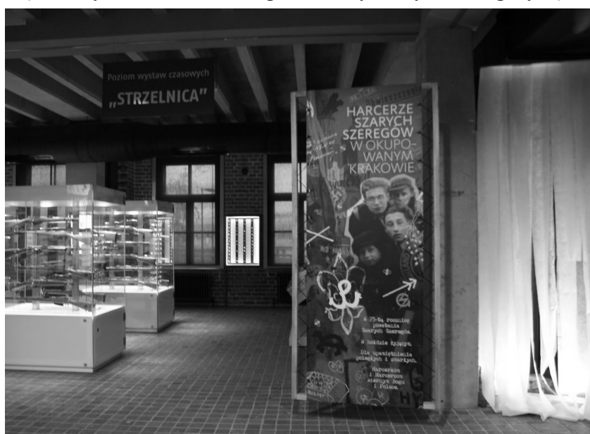
Rys.4. Wystawa czasowa „Strzelnica” w Muzeum AK w Krakowie (Autorzy: D. Kuśnierz-Krupa, J. Kobylarczyk, K. Paprzyca)