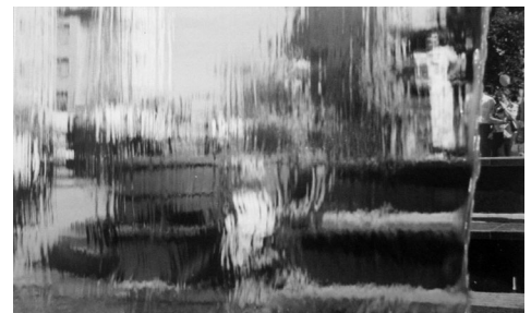
Рис.9. Погляд крізь водоспад.

Аналіз морфології забудови на основних шляхах в'їзду в місто[12] показує, що забудова тут часто ведеться без врахування їх ролі в структурі міста. Житлові багатоповерхівки в останні десятиліття змінили панорами вздовж річок і силует історичного центру. Для ділянок, які сприймаються з мостів через Бистрицю Солотвинську і Бистрицю Надвірнянську, моста через залізницю, важливою є виразна силуетна забудова. Проте при вирішенні верхніх поверхів рядової забудови і доміант часто не враховується даний аспект.