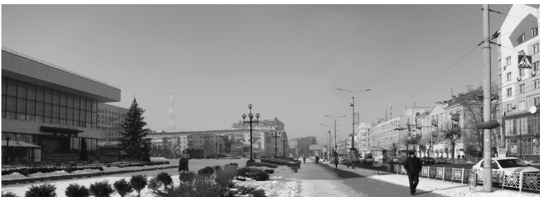
Рис.8. Панорама центру.

Силует центру при в'їзді зі сходу творять забудова та зелені насадження нового центру міста, який виник в першій половині ХІХст. після демонтажу фортечних укріплень. В пострадянський період завдяки вставкам ліквідовані прогалини в рядовій забудові, і силует міста збагатився вирішенням верхніх та мансардних поверхів (рис.8). Оновилися центральні площі, які приваблюють сьогодні жителів міста; кожна з них має відповідну функцію. Вічевий майдан доповнився новим фонтаном, з якого на місто можна глянути крізь водоспад. Вирішення об'єкту додало нових емоцій у сприйняття історичного середовища (рис.9).