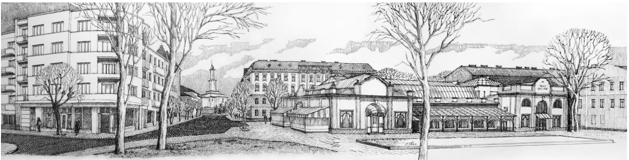
Рис.4. Вид на середмістя з південного заходу. Тут була Тисменицька брама (мал. автора).

Оскільки після ліквідації фортифікацій Станиславова на їх місці не було створено кільцеву рекреаційну зону, як у інших містах тогочасної Австрії, а з укріплень частково зберігся тільки один бастион, сьогодні уяву про межі середмістя дають вали, бастион і забудова на місці колишніх фортифікацій.