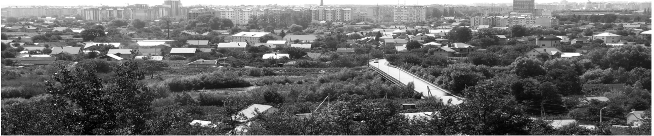
Рис.1. Панорама міста з Вовчинецького пагорбу.

типовими проектами масових серій з домінантами колишніх адмінбудівель промпідприємств, доповнилися новими житловими багатоповерхівками. На початку ХХІ століття силует районів доповнили завершення храмів.