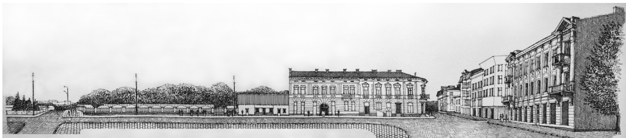
Рис.5. Розгортка по вул. Дністровській. Тут була Галицька брама (мал. автора).

старого ринку (рис.5). Силует міста з південно-східного заболотівського передмістя закритий сьогодні зведеним в радянський період адміністративним будинком.