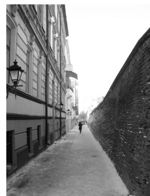
Рис.3. Фортечний провулок.

Середовище середмістя складається з ринкової площі з периметром забудови, приринкових кварталів, палацу Потоцьких, сакральних пам'яток, залишків оборонних фортифікацій, вулиць. У ХVІІІ ст. силует міста «мав вигляд контрастної і водночас гармонійної композиції, що поєднувала в собі висотні домінанти у вигляді: веж сакральних споруд, ратуші та міських брам і