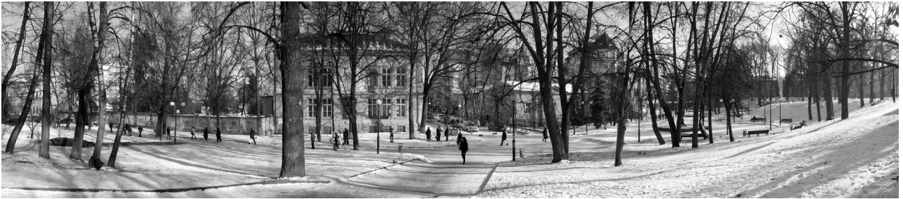
Рис.7. Міський краєвид з валів у сквері на Гетьманських валах.

(рис.7). Таким чином, хоч місто розташоване на рівнині, з підвищеної території колишніх оборонних фортифікацій – бастіону і валів – є можливість огляду міських краєвидів.