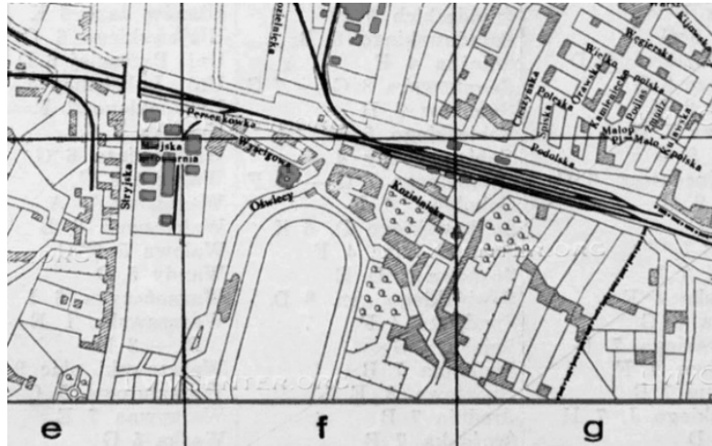
Рис.5. План другого львівського іподрому, 1888 р.

територію площею 45 гектарів, по вулиці Хуторівка, де тепер розміщені не діючі корпуси автобусного заводу.