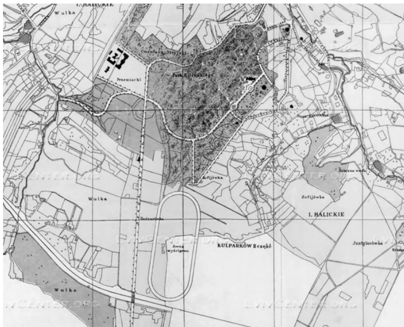
Рис.6. Другий львівський іподром на карті міста Львова, 1922 р.

З 1919-1939 рр. Львів перебуваючи в складі Польщі, посідав друге місце після Варшави в організації перегонів[9].