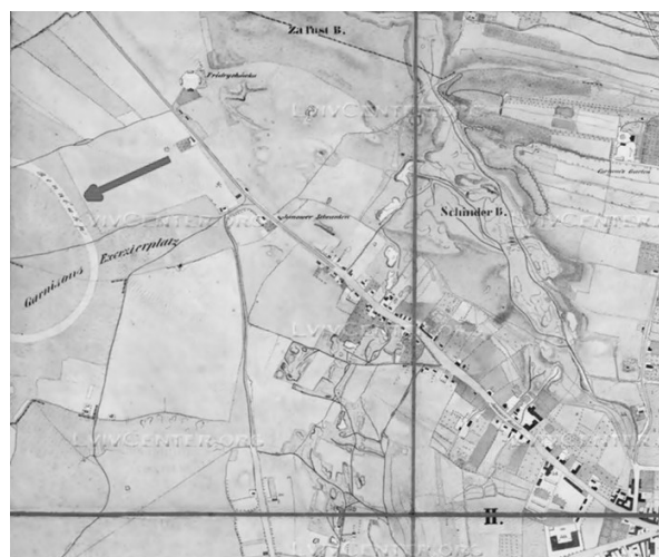
Рис.3. Карта міста Львова, 1844 р. Стрілкою вказано на перший іподром Львова.

Перший іподром, що позначений на планах міста, розташовувався на так званих Блонях (.. Na Włoniach Janowskich..).