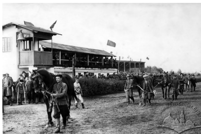
Рис.8. Глядацька трибуна третього львівського іподрому, що розміщувався на Персенківці, фото 1950 р.

Без іподрому Львів залишався зовсім недовго, оскільки вже в 1928 році відбулося відкриття нового місця для кінних забігів. Новий іподром, уже третій по рахунку, розмістився неподалік від свого попередника – на тій же вулиці Стрийській, в межах сучасних вулиці Персенківки та Хуторівки.