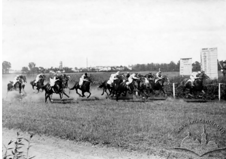
Рис.9. Кінні перегони на третьому львівському іподромі, фото 1950 р.

додавав ліс, який з трьох боків оточував іподром. Після Другої світової війни, уже в радянський час, було проведено часткову реорганізацію іподрому. Було облаштовано зелену трав'яну доріжку довжиною 1620 м, шириною 18 м; була також піщана доріжка, її довжина складала 1780 м, ширина – 4 м. В перегонах брали участь 280 коней, що утримувалися в 16 конюшнях. На іподромі працював ресторан та тоталізатор.