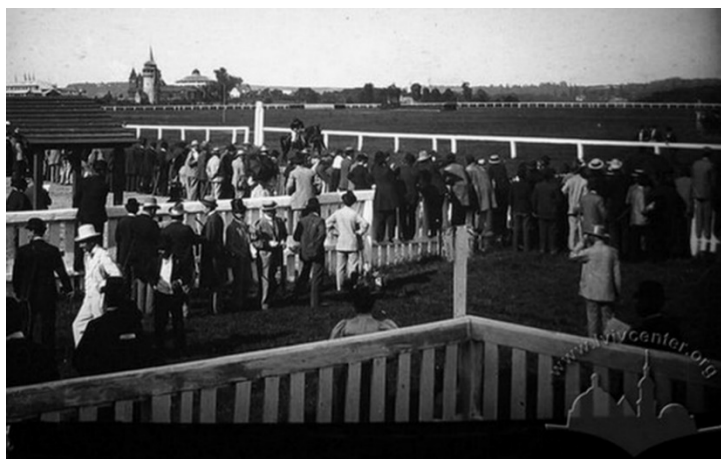
Рис.4. Перегони на львівському іподромі, 1887 р.

У 1886-1889 р. за кошти міста влаштовано другий іподром за Стрийською рогачкою у Львові (вздовж вул. Стрийської від сучасної споруди Податкової адміністрації до залізничної колії, вулиця Козельницького ). На фоні зображення видно об'єкти виставки – водну вежу і будівлю Панорами Рацлавицької.(рис.4)