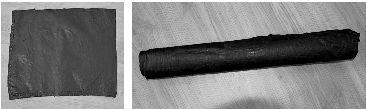
Рис. 3. Зовнішній вигляд екрануючого матеріалу на основі тканини та залізорудного пилу.

Практичне застосування даної розробки. За такої товщини та концентрації металевої субстанції матеріал має досить велику жорсткість і може не перебувати у листовому або рулонному вигляді (Рис.3).