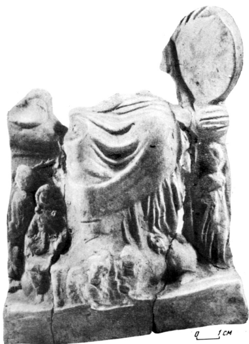
Рис. 3. Фрагментована фігурка Матері богів з ольвійського теменоса

Очевидно, сприйняття ольвійськими греками символіки лева в культурі Матер, і зокрема лева в її ногах, мало передумови в міфологічній і ритуальній сферах, а не було суто естетичним. На статуї з Прієни ступні Матері богів стоять на спині лежачого лева. Вважається, що теракотові зображення наслідували цей монументальний витвір [11, с. 11]. Наявність адептів містеріальних культів і власного епітета богині свідчить про те, що населення було готове до запозичення іконографічних особливостей з малоазійських античних центрів. Причому далеко не всі способи зображень прижились на місцевому ґрунті. Одиначними в Ольвії є знахідки зображення