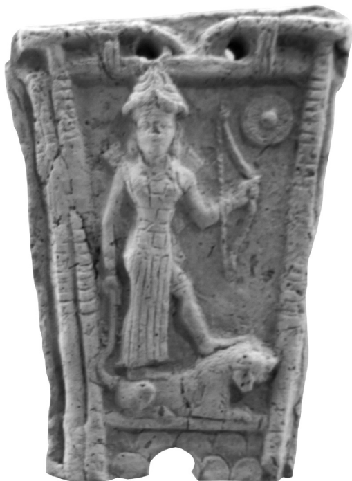
Рис. 1. Теракотова пластина із зображенням Іштар на леві, м. Урук

Іштар як володарка лева зображувалася стоячи на ньому, зокрема на теракотовому рельєфі кінця II тис. до н. е. (рис. 1). Очевидно, образ Матері богів, що спирається ногами на лева, походить саме від неї. Матір представлена сидячи, адже в архаїчний період еллінізована богиня, на зразок інших верховних богів, сідає на трон. Образ божества, що стоїть на леві, і в I тис. до н. е. не покидав Месопотамію. В асирійській Урарті на леві ногами стоїть бог Гальді, який також може зображуватись ногами на коні, кабані або сфінксі [44, S. 941, Taf. CCXVII, CCXIX]. Сирійська богиня стоїть на козлах, обернених у різні боки, або сидить на троні між левами [37, № 170, 173, 176, 186, 189]. Обидві схеми композиції пізніше використовувалися в зображеннях Матері богів і недвозначно вказують на корені іконографії богині.