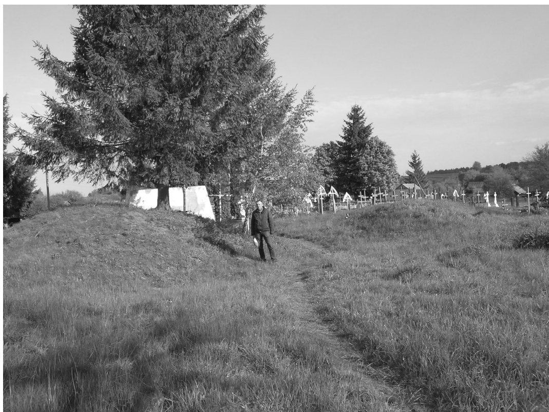
Рис. 3. Сучасні могили поряд з курганами X–XIII ст. на кладовищі с. Желонь, що функціонує з домонгольських часів