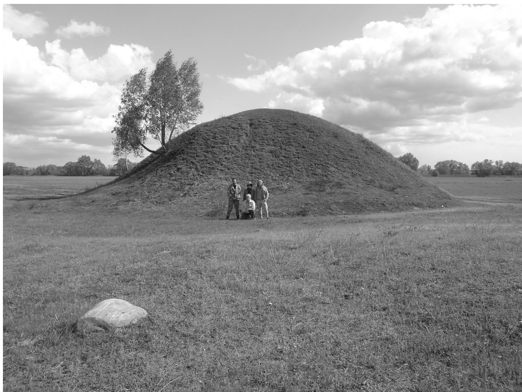
Рис. 2. Курган X ст. поблизу городища в с. Норинськ, яке за археологічними даними функціонувало з X по XVIII ст.