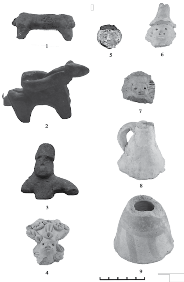
Рис. 1. Образотворчий тип.

Разом з тим, сюжет вершника залишався незмінним. Зокрема, у фондах Музею історії Києва зберігаються дві іграшки, датовані X–XIII ст. (рис. 1, 2, 3). Це стилізована невеличка за розміром фігурка чоловіка, одягнена у високий головний убір, що сидить верхи на коні, тримаючи його за повід обома руками, або в лівій тримає