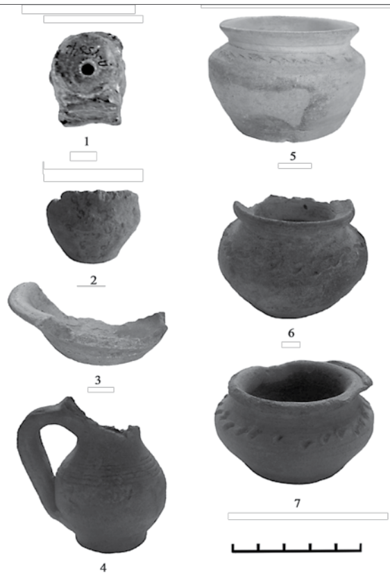
Рис. 2. Господарчо-побутовий тип: 1–7 дитяча посудка

Отже, у добу середньовіччя ці образи, поширені у середовищі багатьох народів, починають втрачати первісний магічний і сакральний зміст і набувають утилітарних якостей – ігрового інвентарю чи виробів декоративно-ужиткового мистецтва. Хоча не можна виключати збереження формальних, сюжетних та образних рис тих давніх часів, коли світ людини залежав від багатьох природних чинників, завдяки яким набував своїх унікальних рис.