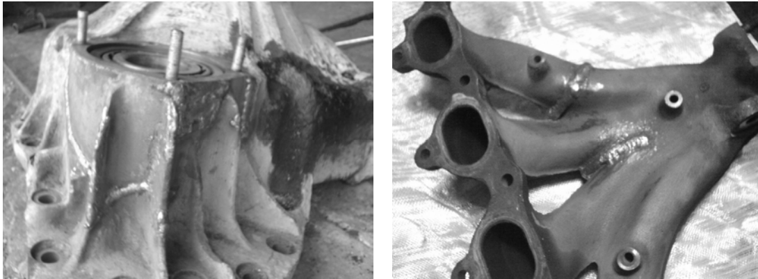
Рис. 1 – Приклади ремонтного зварювання чавунних деталей

Здійснення способу холодного зварювання чавуну (див. рисунок 1.).