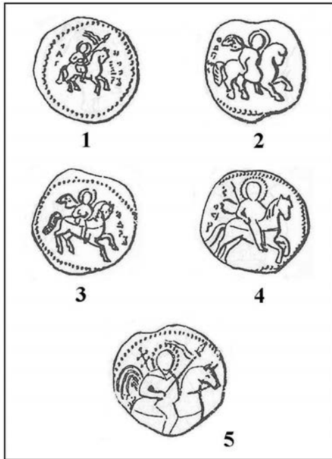
Рис. 2. Зображення вершника св. Федора на давньоруських печатках (за Т. Чуковою) Fig. 2. Image of rider St. Theodore on Old Rus seals (by T. Chukova)

вершників. Дослідженнями встановлено, що на давньоруських буллах зображення святих вершників поширюється з початку XIII ст. [Чукова, 2006, с. 52]. Вшанування святих воїнів пов'язується, перш за все, із князівським військовим середовищем, серед власників печаток, крім князів, є митрополити, монастирі, посадники, тіуни тощо.