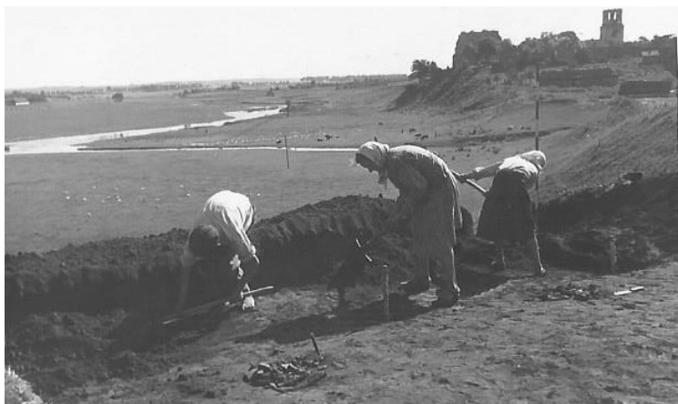
Рис. 2. Зимне (Волинська обл.). Волинська експедиція під керівництвом Ю. Захарука 1956 р. Вид на пам'ятку Fig. 2. Zymne (Volhynian region). Volhynian expedition, led by Ju. Zakharuk. 1956. View at the site

Протягом одного польового сезону (1965) науковець вивчав пам'ятку палеоліту мустье поблизу с. Атаки Чернівецької області, яка в науковій літературі фігурує як Атаки I [О. Черниш 1968, с. 102]. У другій половині 60-х років (з 1966 по 1968 р.) О. Черниш провів археологічні дослідження палеолітичної стоянки Оселівка I [О. Черныш 1969, с. 266], де було виявлено кілька різночасових поселень, які дослідник відносив як до палеолітичного, так і до мезолітичного часу. Варто відзначити, що в складі цієї експедиції існував Волинський загін,