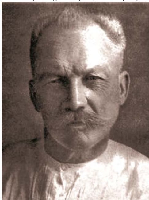
Рис. 4. Микола Макаренко (1877–1938) Fig. 4. Mykola Makarenko (1877–1938)

підвищеного типу та членом правління Гуртка культури українського слова (ГУКУС), котрими керував Микола Зеров; опублікував кілька поетичних збірок під псевдонімом О. Лан: “ Отави косять ” (1928), “ Назустріч сонцю ”, “ Долоні площ ” (1930) [Поліщук, 1997, с. 5–6].