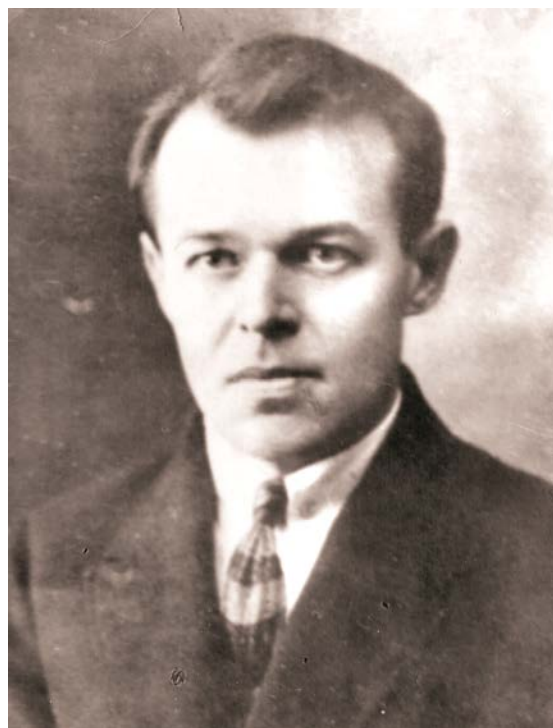
Рис. 5 Сильвестр Магура (1897–1937) Fig. 5. Sylvestr Magura (1897–1937)

2. При тому визнають існування вищих, здатних до культурного розвитку, й нижчих, засуджених на застій, рас. За основний чинник історичного розвитку чи занепаду зважають здебільшого географічне оточення (ландшафт, підсоння, зрошення тощо).