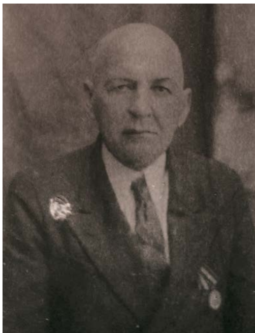
Рис. 9. Михайло Болтенко (1888–1959) Fig. 9. Mykhailo Boltenko (1888–1959)

Проблема обміну – проблема розвитку власності.