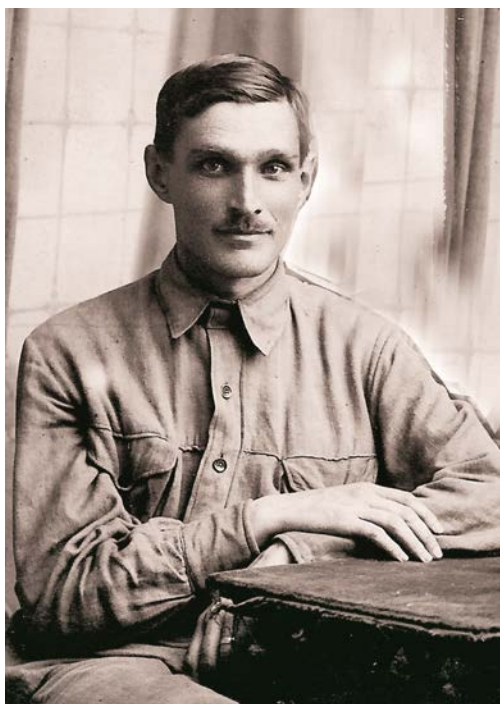
Рис. 7. Петро Курінний (1894–1972)