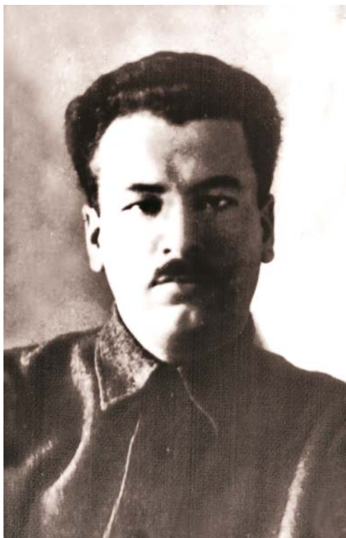
Рис. 1. Кирило Коршак (1897–1937) Fig. 1. Kyrylo Korshak (1897–1937)

Період 1920-х – початку 1930-х рр. на теренах УСРР 1 у вітчизняній історії позначився розквітом національної науки. Політичний курс коренізації (українізації) сприяв розквіту краєзнавчого руху, в рамках якого зріс інтерес до археологічних досліджень регіонів. У перші післяреволюційні роки були реорганізовані або утворені нові науково-дослідні інституції – установи при Всеукраїнській академії наук (ВУАН), вищих навчальних закладах, музеї, науково-дослідні кафедри тощо, які зосередили у своїх стінах більшість т. зв. сформованих дослідників старшого покоління і разом із тим покликали до життя проблему нестачі нових