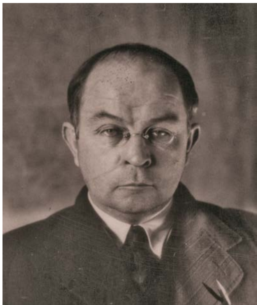
Рис. 8. Віктор Петров (1894–1969) Fig. 8. Viktor Petrov (1894–1969)

Посилаючись на Городцова та його висновки про ролі надбалтського буришину в обміні з насельниками Середземноморського узбережжя, як і Городцов сам вважає за апіорні, Коршак зазначає, що “за такою ж схемою очевидячки можна будувати техніку дослідження усякого іншого археологічного та етнографічного матеріалу”. На нашу думку, саме і не треба будувати дослідження, бо такий спосіб приводить до механістичних, невірних історичних побудовань і концепцій.