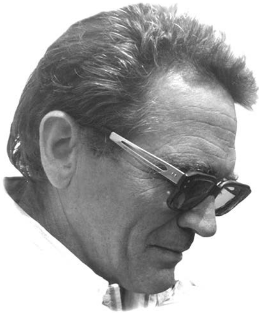
Рис. 6. Ян Гурба Fig. 6. Jan Gurba

чинений глибоким інтересом до вивчення палеолітичної епохи Середнього Подністров'я. Випускник Ягеллонського університету, згодом аспірант Інституту антропології людини в Парижі, він у 1961 р. захистив докторат. Учений досліджував проблеми, пов'язані з кам'яним віком (перехідний період від середнього до верхнього палеоліту), неолітизації Центральної Європи, був керівником низки археологічних експедицій, які провели розкопки палеолітичних