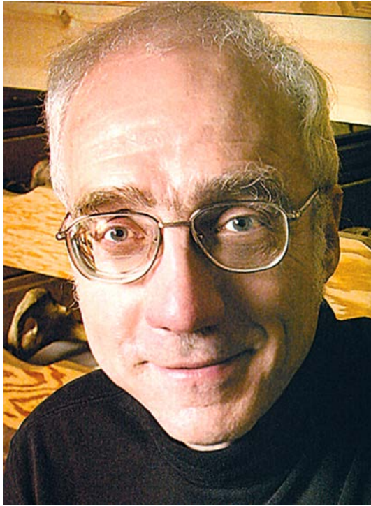
Рис. 1. Річард Клейн Fig. 1. Richard Klein

наукового відрядження до Києва в 1961 р. професор зупинився на два дні у Львові, оскільки Т. Сулімського цікавили польові дослідження працівників відділу археології, особливо періоду бронзової та ранньої залізної доби Галичини [Sulimirski, 1936].