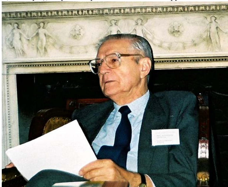
Рис. 2. Александр Гейштор Fig. 2. Alexandr Geish tor

В 1955 р. до Львова прибув заступник директора Інституту історії матеріальної культури Польської Академії наук доктор Александр Гейштор,