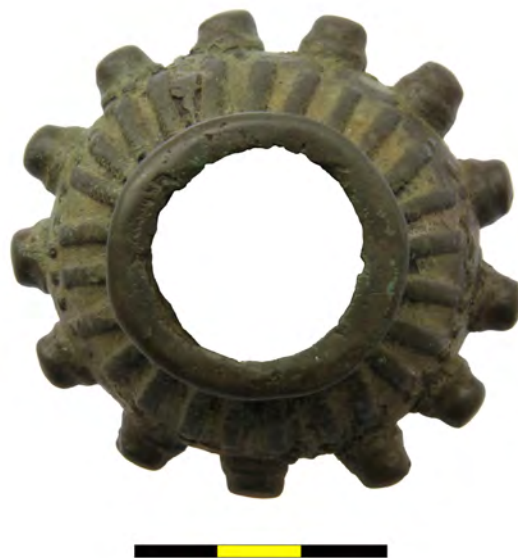
Рис. 2. Бронзове навершя булави з околиці літописного Звенигорода Fig. 2. Bronze pommel of mace from the outskirts of annalistic Zvenyhorod