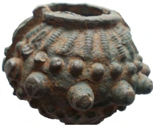
Рис. 4. Знахідка з княжого Галича (за І. Коваль, І. Миронюк, 2015)

Існують певні труднощі з датуванням описаного зразка ударної зброї. Знахідка не