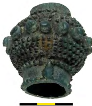
Рис. 5. Бронзове навершя булави з Хмельницької обл.