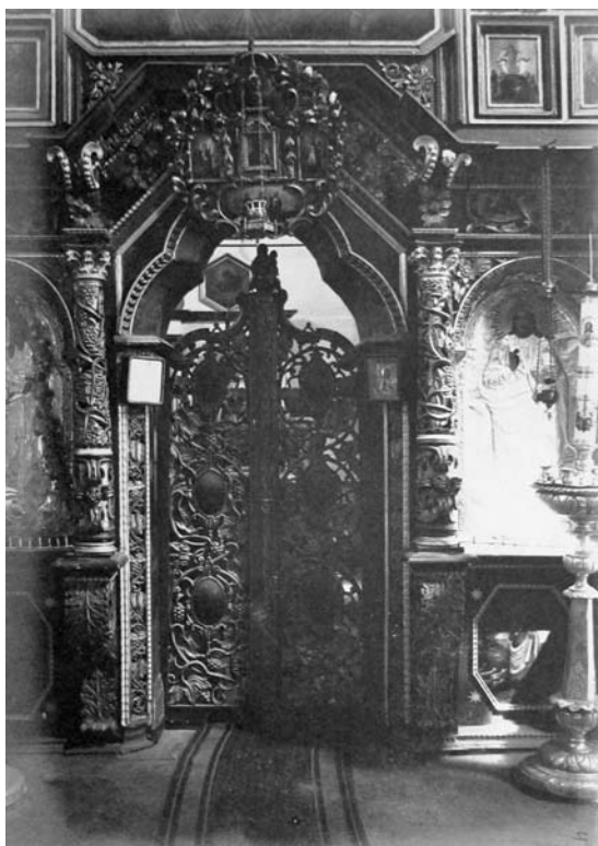
Рис. 4. Різьблені царські врата дерев'яної церкви у Білгородці. Фото 1910-х рр.

Fig. 4. The curved royal gates of the wooden church in Bilohorodka. The photo of 1910s