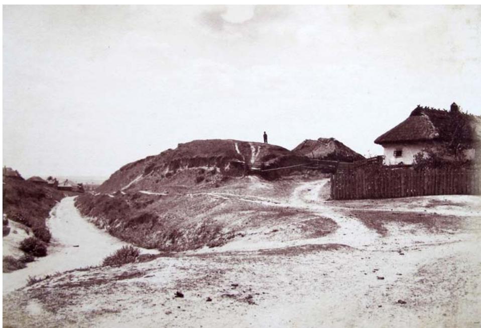
Рис. 6–7. Загальний вигляд Білгородки з валами. Фото 1910-х рр.