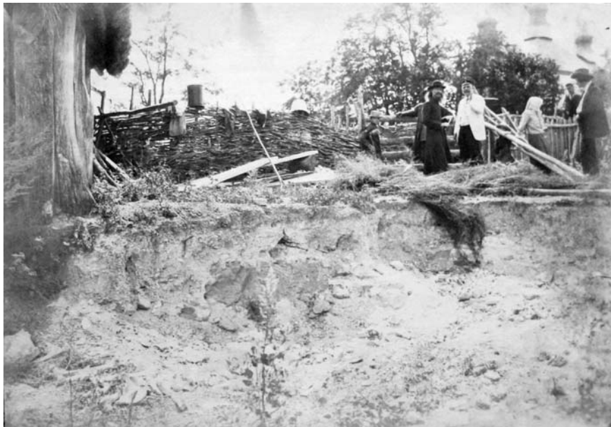
Рис. 9. Павло Альошин з невідомим на розкопках у Білгородці. Фото 1910-х рр.

Fig. 8. The detail of the archaeological excavations in Bilohorodka area. The photo of 1910s