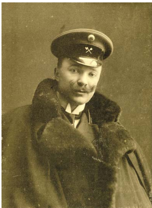
Рис. 1. Павло Федотович Альошин (1881–1961). Світлина 1910-х рр. Fig. 1. Pavlo Fedotovych Alosyn (1881–1961). The photo of 1910s

на розвиток міста і обіймаючи численні посади, працюючи експертом і консультантом на багатьох об'єктах. Після війни завдяки його проектній діяльності відновлено найважливіші для Києва пам'ятки архітектури – університет, колишні Інститут шляхетних дівчат та Маріїнський палац. Як професор Київської академії мистецтв виховав учнів, багато з яких стали відомими архітекторами – Й. Каракіс, В. Заболотний, П. Юрченко та інші (рис. 1).