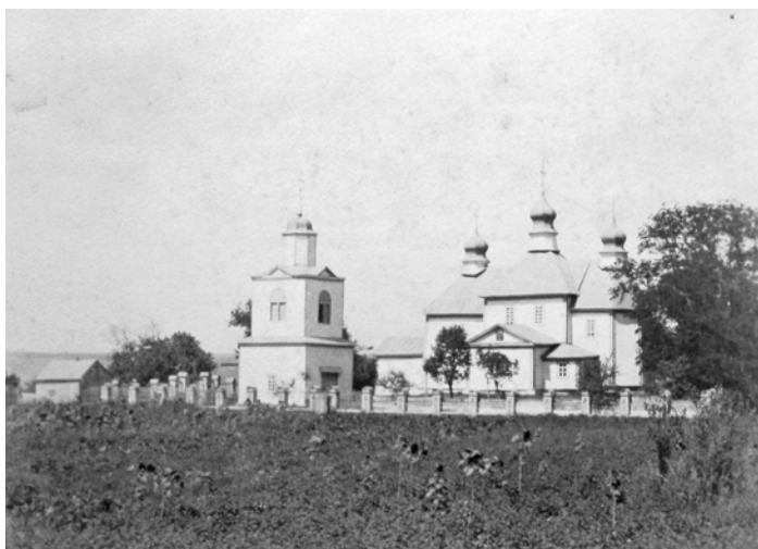
Рис. 2. Загальний вигляд дерев'яної церкви у Білгородці. Фото 1910-х рр.