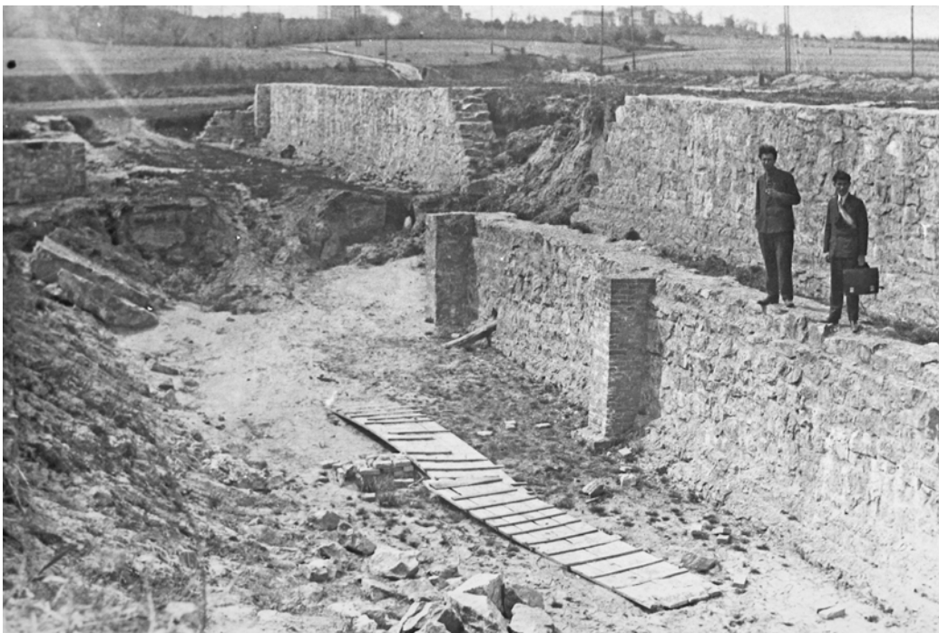
Рис. 10–11. Фундаменти на неатрибутованій фотографії 1930-х рр. Fig. 10–11. The basement in the unattributed photo of 1930s

Потім зроблено наукову доповідь, після якої детально оглянули вали із залишками дерев'яних укріплень. У розповіді про екскурсію зустрічаємо скарги на те, що давні вали розкопували селяни, свою справу робили також вітер і вода. Невдовзі від грізних валів не залишиться й сліду. О шостій вечора група повернулася до Києва, але дехто ще відвідав засідання Товариства Нестора-літописця, де професор В. Данилевич виголосив доповідь про розкопки в Білгородці.