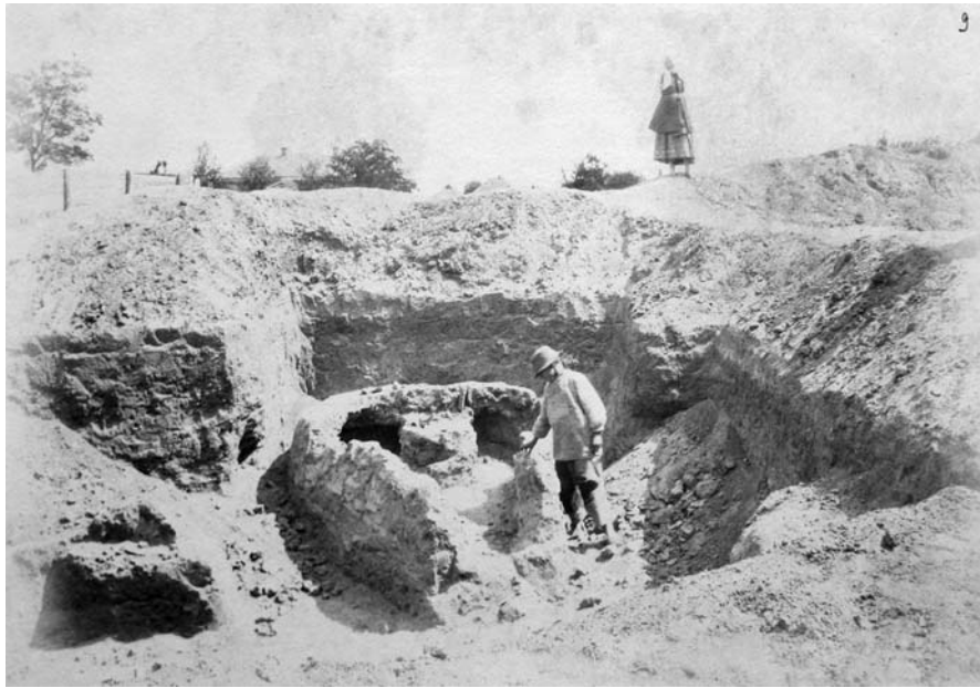
Рис. 8. Фрагмент ділянки археологічних розкопок у Білгородці. Фото 1910-х рр.

Fig. 8. The detail of the archaeological excavations in Bilohorodka area. The photo of 1910s