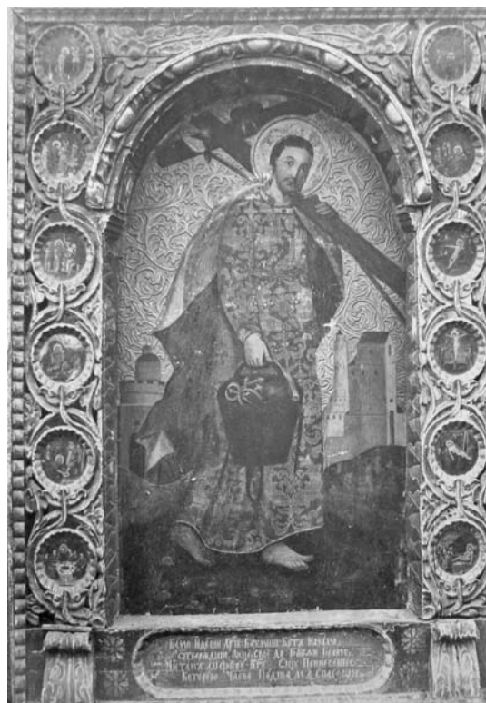
Рис. 5. Ікона з дерев'яної церкви у Білгородці. Фото 1910-х рр.

Fig. 4. The curved royal gates of the wooden church in Bilohorodka. The photo of 1910s