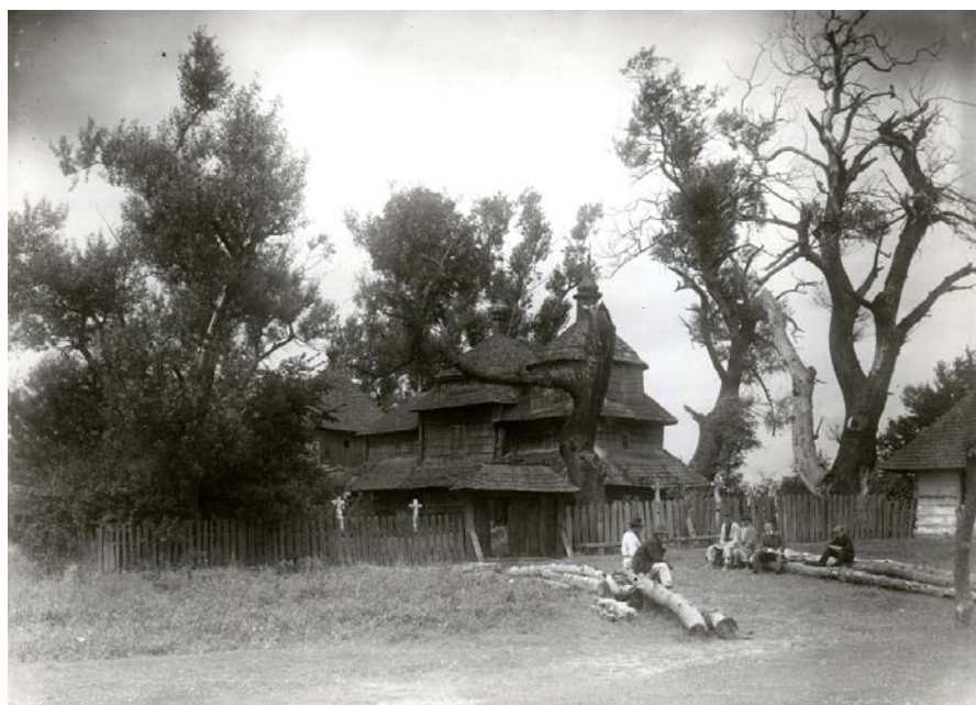
Рис. 6. Ярослав Пастернак біля церкви в с. Магерів Жовківського повіту. 1913 рік