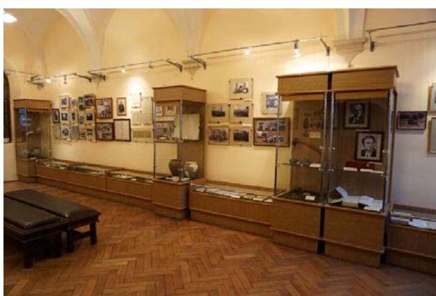
Рис. 2. Експозиція виставки Fig. 2. Exposition of the exhibition

Доля вченого пов'язана з Львівським історичним музеєм. Він був першим директором цієї інституції у лютому–червні 1940 р. Не дивно, що ми створюємо присвячені йому виставки.