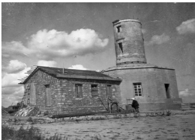
Рис. 3. Сигнальна станція під час відновлювальних робіт. Орієнтовно 1947 р. (НА ІА НАНУ, ф. 17, спр. 146) Fig. 3. The Signal station under reconstruction. Approximately 1947

поза участі Л. Славіна. Крім того, важливим фактором було те, що за офіційними даними (на 1946 р.) в музеях УРСР на зберіганні було близько 1 млн. експонатів, 40 % – предмети, що склали археологічну групу, 20 % – нумізматичні предмети [ЦДАГО України, ф. 1, оп. 70, спр. 594, арк. 8].