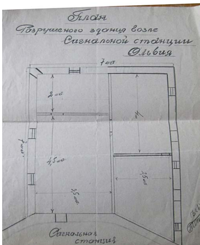
Рис. 4. План приміщення біля Сигнальної станції. 1947 р. (НА ІА НАНУ, ф. 17, спр. 146) Fig. 4. Plan of the building Signal stations. 1947

важливим для розуміння того, яке значення Л. Славін надавав Ольвійському заповіднику та його музею. В цей період вчений крім дослідницької та викладацької діяльності ще й обіймав досить високі адміністративні посади – директор, а потім заступник директора ІА АН УРСР. Але власним прикладом, опікуючись і переймаючись справами власної експедиції, якою він керував з 1936 р., він показував важливість швидкого відновлення тих втрат, яких завдала війна культурній спадщині країни.