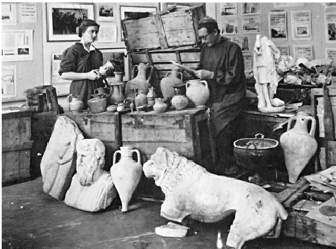
Рис. 2. У фондах Одеського археологічного музею (НА ІА НАНУ, ф. 17, спр. 146)

варто звернути увагу, – це участь в дослідженнях археологічних пам'яток УРСР представників наукових інституцій з Москви і Ленінграда. Певно залучення, а часто верховенство вчених з цих центрів у веденні археологічних досліджень стало основним інструментом в поєднанні трьох найбільших археологічних осередків на місцях: Москви, Ленінграду та Києва, – та об'єднання їх у спільному баченні вивчення матеріальної культури – історичному матеріалізмі відповідно до марксистсько-ленінсько-сталінської концепції історії.