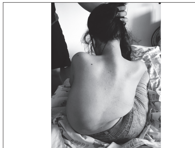
Рисунок 1. Беременная в сроке 35 недель со спинальной амиотрофией Верднига — Гоффмана