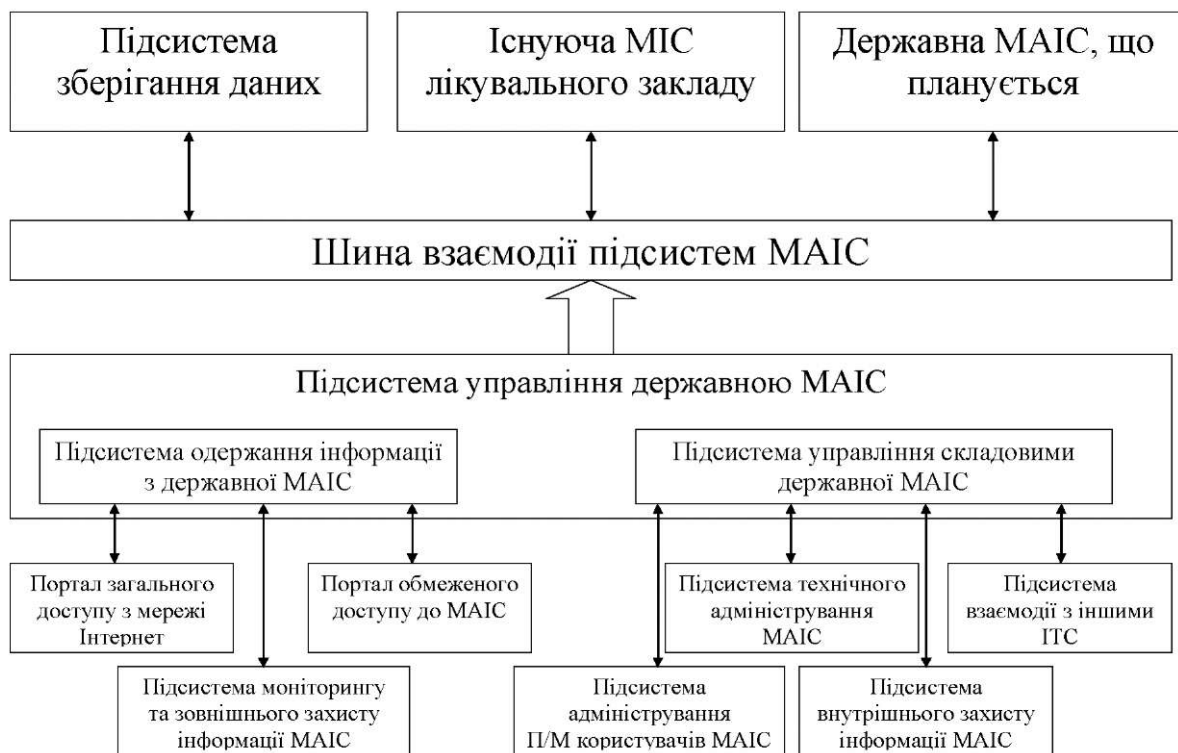
Рис. 1. Структурна схема медичної автоматизованої інформаційної системи.

1. Підсистема зберігання даних (ПЗД) складається з електронного архівного сховища, що при-