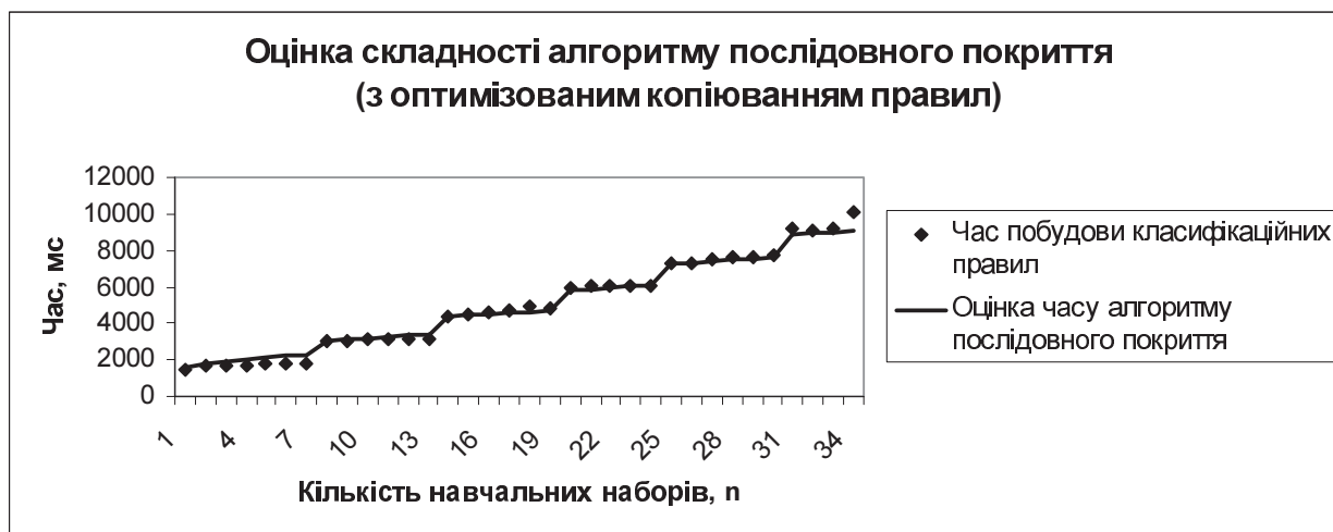
Рис. 2. Порівняння результатів чисельного експерименту на основі оптимізованого копіювання правил з оцінкою складності алгоритму (3).