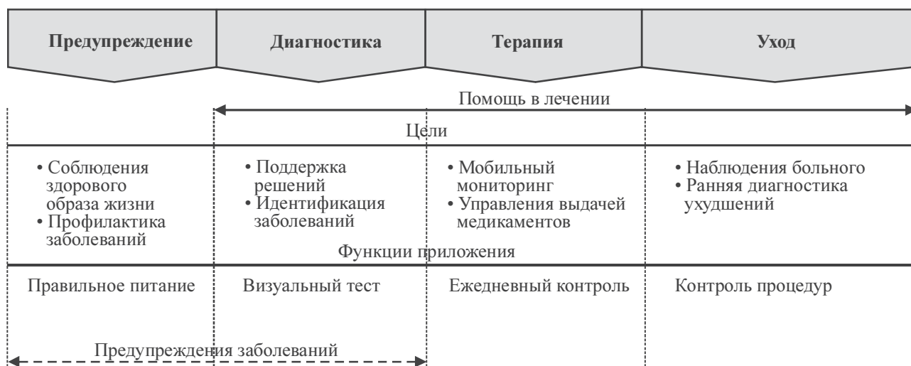
Рис. 2. Разделения функциональных возможностей по группам [3].

ложения, основываются на определенных временных, пространственных или математических показателях. Поэтому эти данные нельзя считать достоверными и точными, что делает их бесполезными для использования в медицине. Конструкция телефонов не предусматривает наличие специальных датчиков, которые могут дать достоверные данные для точного прогноза.