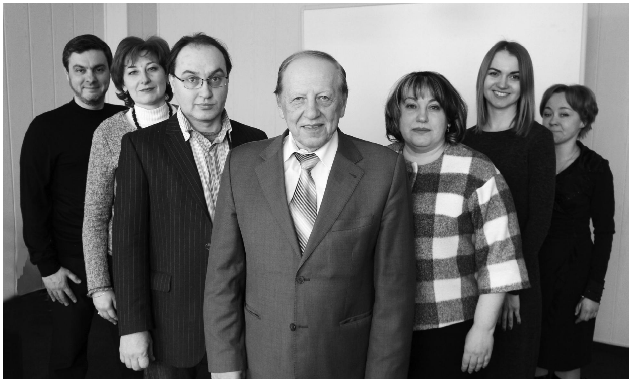
Рис. 2. НПП кафедри медичної інформатики, 2018 рік

Запропоновано систему типових навчальних планів з безперервного професійного розвитку (БПР) викладачів, сценарій проведення