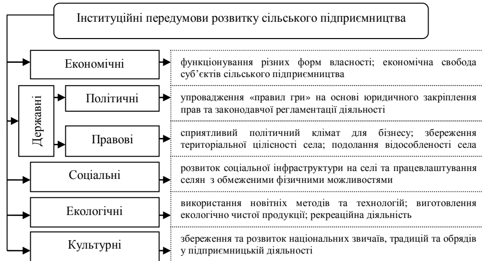
Рисунок 2 – Інституційні передумови розвитку сільського підприємництва, (розроблено автором)

Основні проблеми оцінки інституційного середовища розвитку сільського підприємництва пов'язані з обмеженою кількістю статистичної інформації. Незначні масштаби даних не дають змоги повною мірою оцінити вплив інституцій та інститутів на розвиток і функціонування підприємницьких формувань, а також визначити взаємозв'язок між ними. Інституційний аналіз підприємницької діяльності базується на використанні методик, розроблених відомими міжнародними агентствами та фундаціями: Transparency , Weforum , Doingbusiness , Freedomhouse , Heritage Foundation , Worldbank , EBRD та GEM , використання яких дає змогу більш детально проаналізувати показники-індикатори розвитку підприємництва, оцінити стан його розвитку на національному та міжнародному рівнях. Серед них такі, як: кількість відкритих підприємств, офіційне працевлаштування найманих працівників, реєстрація прав власності, сплата податків, отримання інвестицій та захист прав інвесторів, укладення договорів і злиття підприємств. За отриманими результатами, кожна з країн повинна самостійно обирати, які заходи з регулювання підприємницької діяльності їй краще прийняти для забезпечення успішного розвитку держави в цілому.