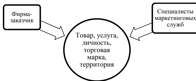
Рисунок 4 – Суб'єкти і об'єкт ІМК

Відміння від інших визначень ІМК враховані всі варіанти інтеграції як безпосередньо інструментів маркетингових комунікацій між собою (реклама, публік рилейшнз, директ-маркетинг, стимулювання збуту), з іншими складовими маркетинг-микс (наприклад, модернізація товару, цінові стратегії, логістичні схеми), так і з допомогою інформаційних технологій інтернет-комунікацій. В авторському визначенні ІМК вказано об'єкт просування, яким може бути товар, так і торговельна марка, бренд, особистість, територія. Суб'єктами ІМК, з нашої точки зору, виступають фірма, інформація про яку необхідно доставити потенційним клієнтам, і маркетолог, формуючий комплекс ІМК (який може бути представителем сторонньої організації або входити в штат фірми), рис. 4.