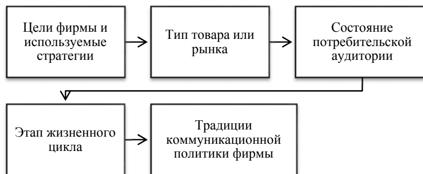
Рисунок 5 – Факторы, влияющие на состав комплекса ИМК

Процесс формирования комплекса мероприятий ИМК сложный и длительный. Чтобы определить оптимальную структуру комплекса интегрированных маркетинговых коммуникаций, необходимо учесть факторы, которые целесообразно объединить в группы, рис. 5.