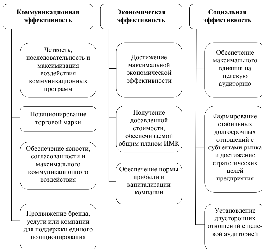
Рисунок 1 – Формулировки целей интегрированных маркетинговых коммуникаций

Таким образом, на сегодняшний день отсутствует единый подход к научному определению ИМК. Анализ множества формулировок позволил выделить три вида целей ИМК: коммуникационную, экономическую и социальную. На рис. 1 мы привели различные определения целей, сформулированные учеными.